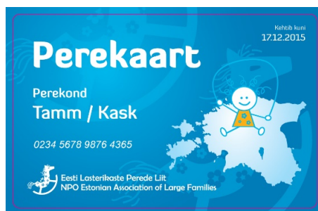
Joonis 2. Perekaardi näidis

Kui klassikaliselt on kliendikaart konkreetse ettevõtte poolt välja antav sooduskaart, mida saab huviline kasutada olenemata perekondlikust kuuluvusest, soost ja vanusest (v.a teatud juhtudel alaealised lapsed), siis Eesti Lasterikaste Perede Liidu poolt väljastatud Perekaart on suunatud perekondadele, kus on kasvamas neli ja enam last. Alanud on diskussioon Perekaardi võimalikust laiendamisest kolmelapselistele peredele. Perekaart eristub klassikalisest kliendikaardist kaasatud partnerite paljususe poolest ning seda on võimalik kasutada selgelt piiritletud sihtgrupil.