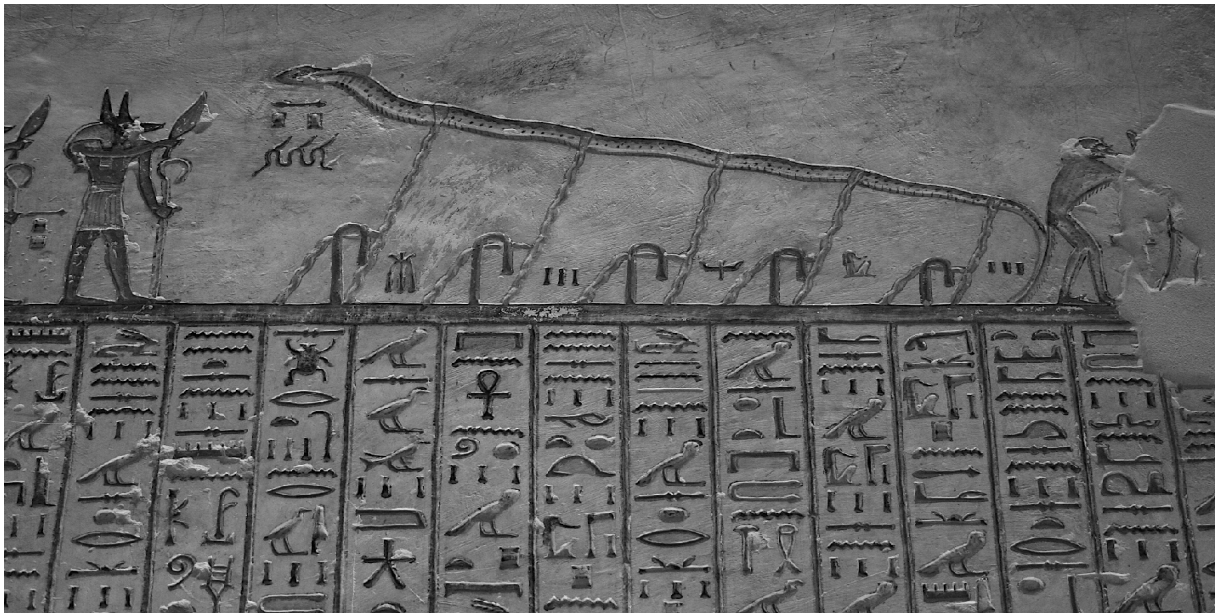
Illustratsioon Numbrivahemik Illustratsioon: Sethi ja Apophise vastasseis

allilma järve sõitmist, olles selle tühjaks joonud. Torgete tõttu purskusid roomaja kõhus olnud veed taas valla ning Ra sai jätkata oma rännakut, et hommikul taas oma kuldse vankriga üle taevavõlvi sõita. Siin pole Seth enam mõistetamatu, ega reeglipäratu, vaid pigem kangelaslik, koletiste-tapjast, maailma hoidev jumalus. 21