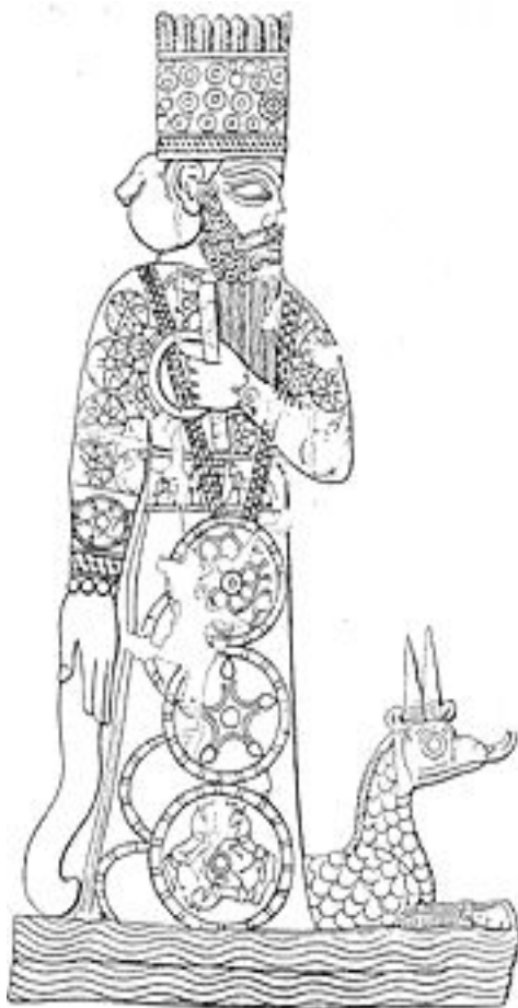
Illustratsioon Numbrivahemik Illustratsioon: Marduk võidukalt mušhuššu seljas.

Jumalaid kujutati nende valitsuse all oleva deemoni üle justkui pedestaalil. Jumal seisis oma allutatud koletise peal, vahel käes nõõrid, mis mõeldud deemonliku olendi juhtimiseks. Selline positsioon andis kinnitust, et allutatud olendi võimed olid jumala kasutada, loom ise sümboliseeris tema allutanud jumala jõudu. Levinuim kujutis sellest on sõdalane Marduk uhkelt oma allutatud mušhuššu -draakoni seljas. 43