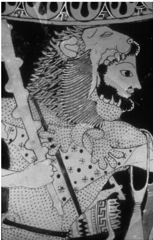
Illustratsioon Numbrivahemik Illustratsioon: Herakles nuiaga, Nemea lõvi nahk seljas.

Esimese ülesandena andis Eurystheus Heraklesele käsu hävitada haavamatu Nemea lõvi, kes elas Argolises Nemea linna lähedal. Nemea lõvi elas kahe väljapääsuga koopas. Ühe ette veeretis Herakles kivimürakaid ja ootas siis, kuni lõvi teisest nähtavale ilmub. Algul katsus Herakles lõvi hävitada vibu ja noolte, siis oma oliivipuust nuiaga, ent kõik need osutusid kasututeks, sest lõvi nahk oli läbimatu. Lõpuks õnnestus Heraklesel lõvi kägistada ning surnud loomalt nahk maha võtta. Mees tõi korjuse Mükeenesse näha. Eurystheus ehmatas surnud lõvi nähes väga. Enam iialgi ei käskinud ta tapetud loomi linna sisse tuua, vaid piirdus sellega, et neid linnamüüri pealt näha sai. Edaspidi kandis Herakles lõvi nahka nii, et selle pea moodustas midagi