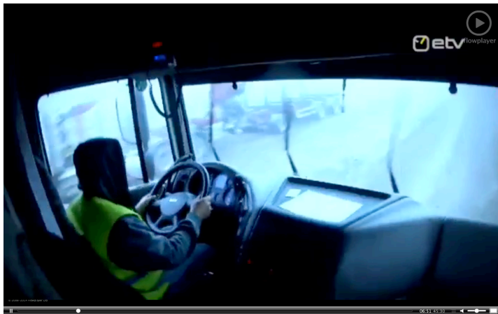
Pilt 4. Salakaameraga filmitud tõestusmaterjal.