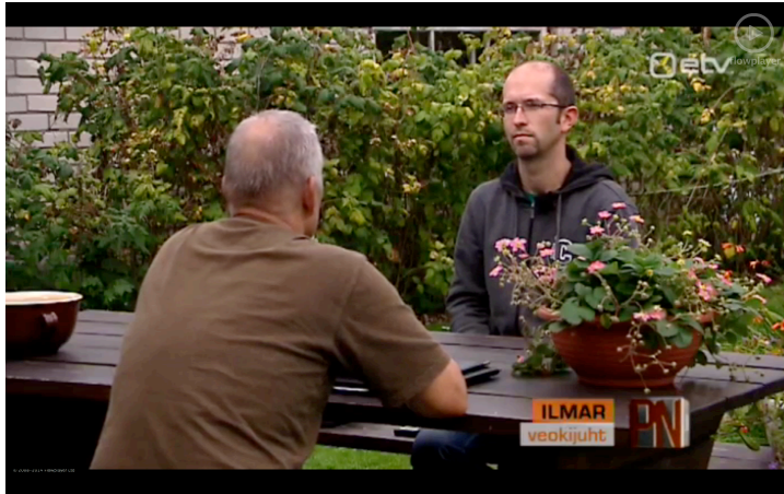
Pilt 3. Varjatud allikas.