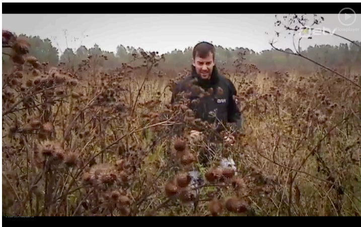
Pilt 5. Ajakirjanik umbrohustunud põllul.

Ühe isiku väga konkreetset süüdistamist on siiski proovitud tasakaalustada mitmete ametnike kaasamisega. Samas on konkreetset Vackermanni kaasusest rääkimine probleemne, seda mainib ajakirjanik ka loos, sest PRIA ei või detaile avaldada. Seega süüdistuste täielik õigsus jääb siiski vaid oletuste baasile.