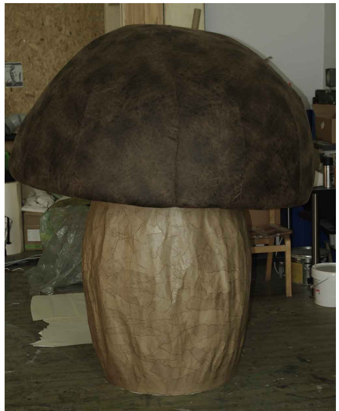
Joonis 8. Seen