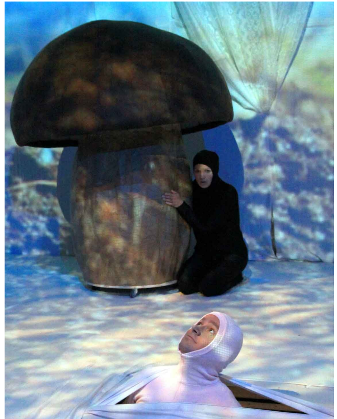
Joonis 7. Sipelgas seene all

Seene kübara karkass oli veidi lopergune metallvõrest poolkera. Karkassi katsin kahesentimeetrise porolooniga. Kuna tegu polnud sümmeetrilise konstruktsiooniga, siis eraldi lõiget seene kübarale ei saanud teha ja katmine toimus karkassi peal otse mõõtes, lõigates ja liimides (liimimisel kasutasin Tixo kontaktliimi). Porolooni katsin trikotaažkangaga, mille mõõtmine toimus samuti otse porolooniga kaetud karkassi peal. Trikotaaž on üks parimaid kangaid, mida selliste tööde puhul kasutada just venimise tõttu, sest kanga venitamisel saab kergelt eemaldada kõik kortsud ja ebatasasused. Kanga õmblesin porolooni peale käsitsi. Käsitsi õmblemine on ka üks aeganõudvamaid töid taoliste suurte dekoratsioonide puhul, kuid ilma lõiketa töötades ja otse karkassi peal mõõtes on see ilmselt ainuvõimalik tehnika.