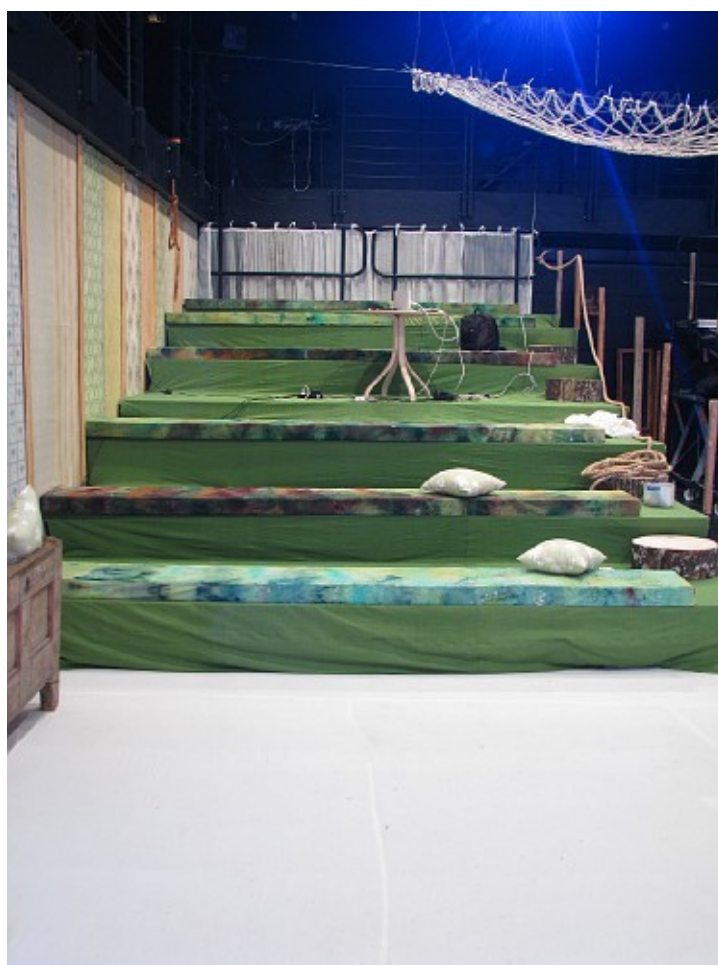
Joonis 1. Vaade lavalt istumiskohtadele

Lavastus leiab aset Endla teatri Kūūnis, mis on black boxi -tüüpi lavaruum. Üheks tähtsamaks osaks lavastuses on see, et lavakujundus haarab endasse terve saali ja publik on haaratud tegevusse. Tihti on kõige nooremale publikule suunatud lavastused samuti publikut kaasavad, kuid need kaasavad lapsi nendega otse suheldes, kuid antud lavastuse puhul on publik toodud lavakujunduse abil loosse sisse. Näitlejad ei suhtle publikuga otseselt ja publik saab neid jälgida kõrvalt nagu ta jälgiks kõrvalt päris putukate toimetamist. Tähtis detail on ka see, et lavastuse ajal on publikul lubatud rääkida (kuna näitlejad suhtlevad vaid hääliksuste kaudu, siis lugu ise kaduma ei lähe), mis annab laste vanematele võimaluse seletada lastele, mis toimub ja samal ajal tõmmates ka vanemad antud loosse (või maailma) sisse.