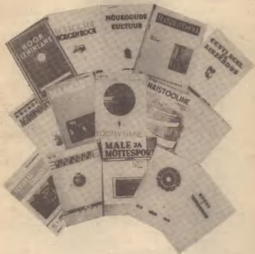
1941.a. ilmunud ajakirju.