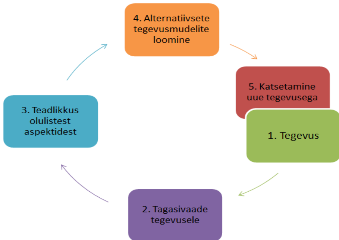
Joonis 2. Korthageni ja Vasalose reflekteerimismudel ALACT (Refleksioon õpetaja professionaalses arengus 2019).

5.etapp: testitakse/ katsetatakse uut tegevust ( trial ) ning ühtlasi on see uue ringi algus.