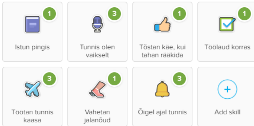
Joonis 1. Kuvatõmmis ClassDojo rakendusest

(What is ClassDojo, s.a). Õpetajad saavad lisada õpitavaid oskusi vastavalt vajadusele ning määratleda ise ka ära punktisumma, kui palju üks või teine oskus punkte annab. Oskuste sõnastusi saab muuta, kustutada ning selle visuaalset poolt disainida vastavate emotikonidega: