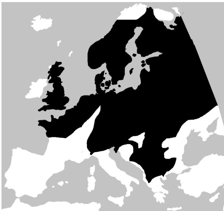
Lisa 5. Hariliku rästiku levila (mustaga tähistatud ala, Wikimedia commons).