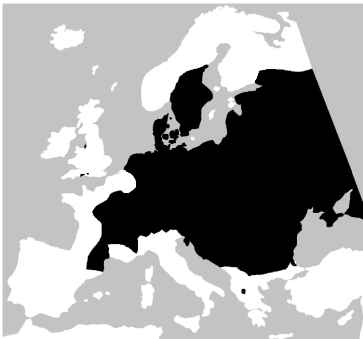
Lisa 3. Kivisalisliku levila (mustaga tähistatud ala, Wikimedia commons).