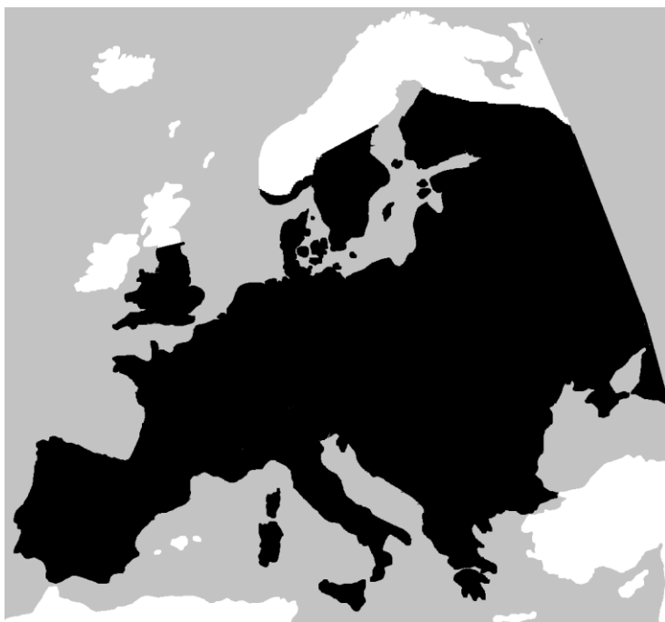
Lisa 2. Hariliku nastiku levila (mustaga tähistatud ala, Wikimedia commons).