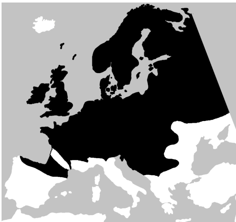
Lisa 4. Arusisaliku levila (mustaga tähistatud ala, Wikimedia commons).