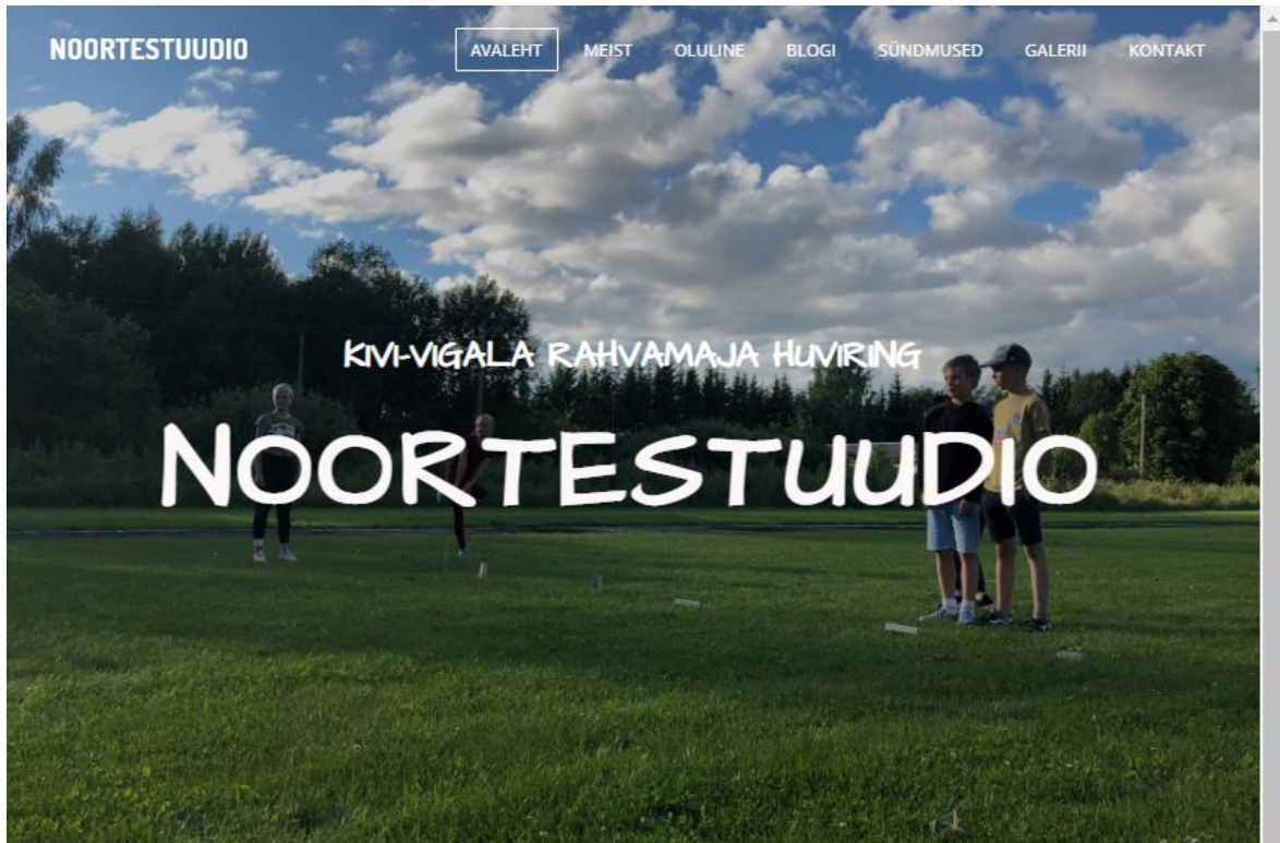
Foto 3. Noortestudio kodulehekülje avaleht

Kodulehekülje aadress on noortestudio.weebly.com