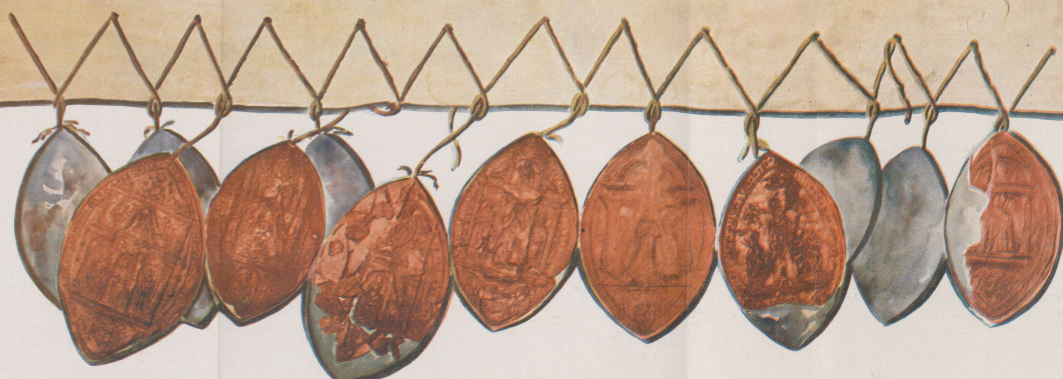
Tallinna Oleviste kiriku Maarja kabelile 12 kardinali poolt Roomas 3. mail 1509. a. antud patu- kustutuskiri. Vasakul ülal Püha Olev, keskel Maarja Jeesusega, paremal Püha Laurentius ja kahel pool kõrval paavsti vapid. Kinnitatud väljastajate kardinalide pitseritega plekk-karpides. Tallinna linnaarhiivi välimusest ilusamaid pärgamentürükuid.