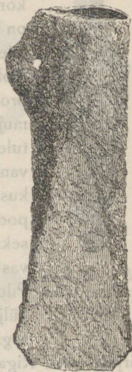
Pilt 3. KIRVES. Halliste, Taru tl. kalmistust.