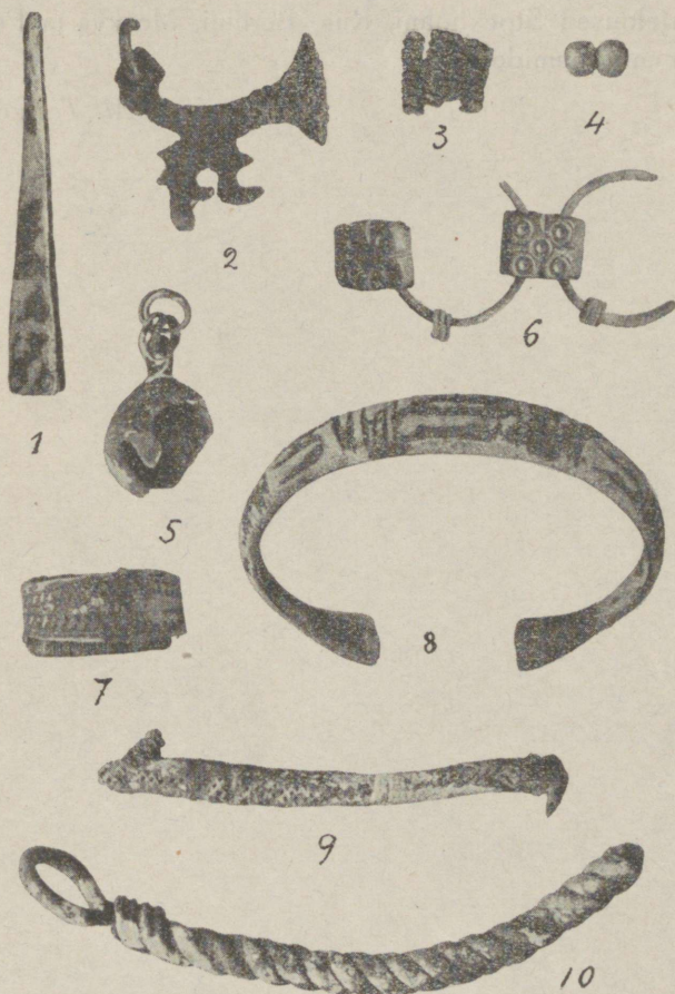
Pilt 5. Asju Taugasalu leiust.

Üks kord on niisugune ka Leedust leitud. See levimine on võimalik mälestus aktiivsete saarlaste liikumisest. — Suuremalt osalt on (pildil 5 kujutatud) asjad vist naiste tarvitatud. Ripandid on seda kindlasti.