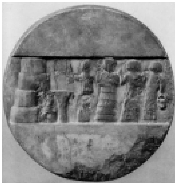
Рис 1. Энхедуанна, Халколитовый диск из Ура, Филадельфия (Orthmann 1985, 101 )