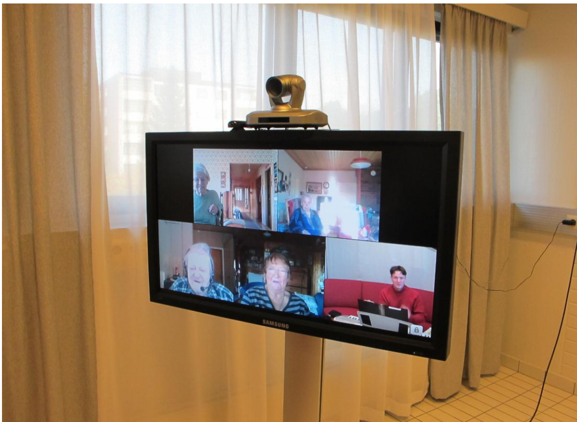
Pilt 2. Ekraan keskuses.