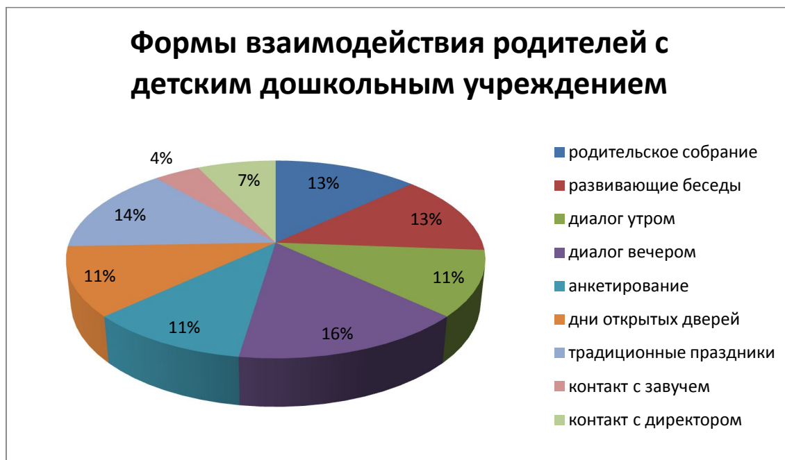
Рисунок 6. Формы взаимодействия семьи с детским дошкольным учреждением в формировании ценностей детей.

Отвечая на вопрос, через какие формы осуществляется взаимодействие с детским садом в процессе формирования ценностей ребенка, родители указали все предложенные формы взаимодействия с детским дошкольным учреждением в процессе формирования ценностей, частоту использования разных форм можно видеть на рисунке 6. Большинство родителей (76%) выделяют из всех форм взаимодействия диалог в вечернее время, традиционные мероприятия (71%), развивающие беседы (65%) и родительские собрания (65%). В предложенных формах прослеживается принцип взаимного доверия и уважения, построенного на диалоге, о важности, которых говорится в государственной учебной программе (Учебная программа 2008: 3). Полученные результаты также подтверждают использование традиционных форм взаимодействия при формировании ценностей между родителями и педагогами (Сутроп 2008: 6).