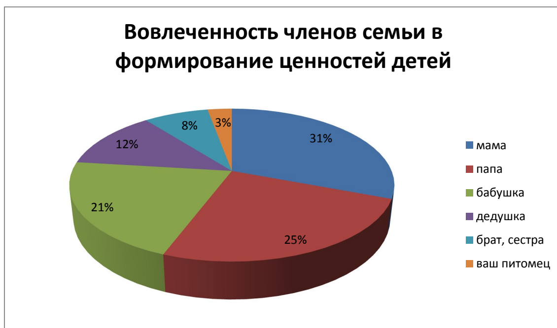
Рисунок 3. Частота вовлеченности разных членов семьи в процесс формирования ценностей детей.

Первый блок вопросов помогает изучить, какие формы используют родители при формировании ценностей детей. Дети учатся ценностям не только, действуя, самостоятельно, но и перенимая опыт от других людей, которые через речь и принятые в культуре нормы, помогают осознать и принять новые образцы поведения (Учеба и обучение ... 2008: 105, 106). Исходя из этого, у родителей спросили, кто вовлечен в процесс формирования ценностей их детей в семье. В нижеприведенном рисунке можно видеть частоту вовлеченности разных членов семьи, в том числе и домашнего питомца в 3% (см. рисунок 3).