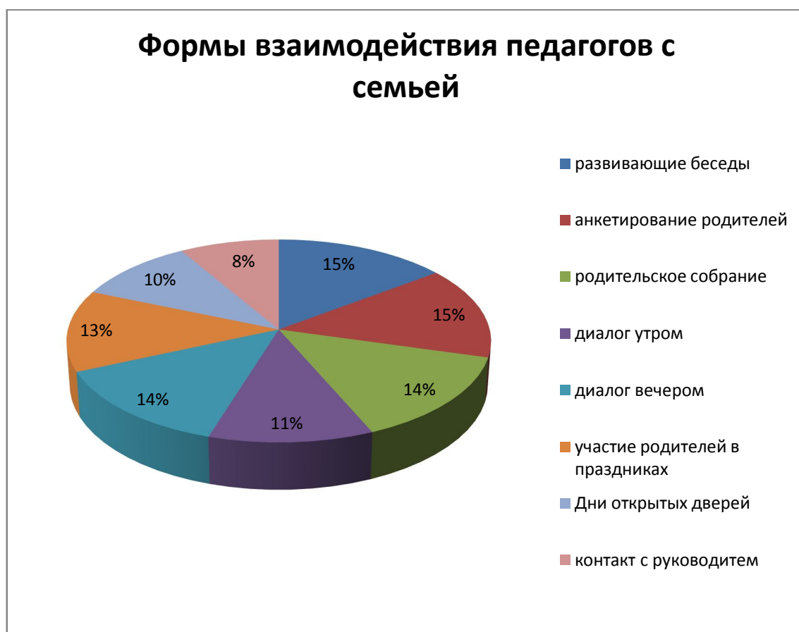
Рисунок 2. Формы взаимодействия педагогов с семьей при формировании ценностей у детей.

Среди всех предложенных форм взаимодействия с семьей респонденты указывают все варианты ответов. На рисунке 2 можно видеть частоту использования форм на фоне других.