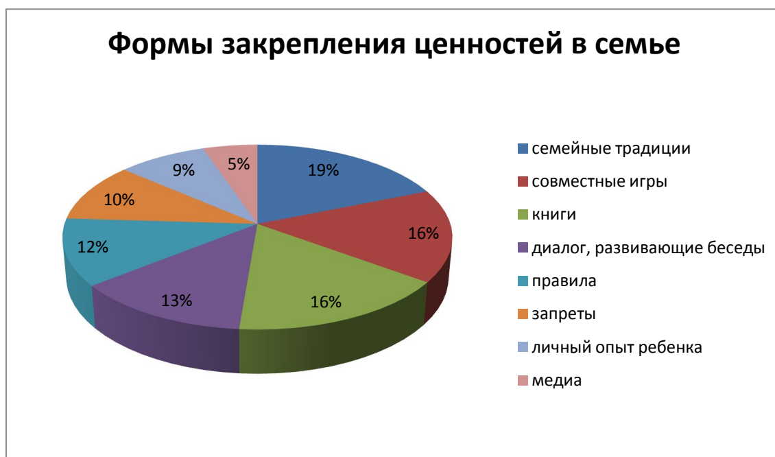
Рисунок 4. Частота форм формирования ценностей в семье.

работы восемь вариантов ответа. Ниже рисунок наглядно изображает все восемь форм закрепления ценностей в семье.