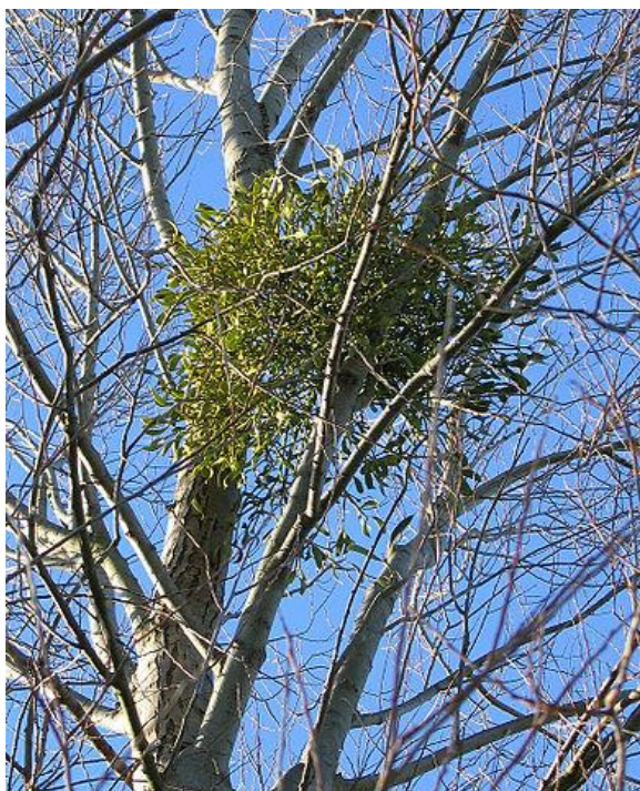
Pilt 2. Harilik puuvõõrik ( Viscum album ) arukase küljes (Dunn, 2004)