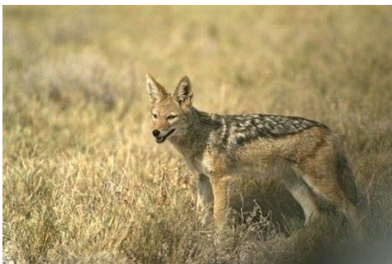
Pilt 1. Šaakal ( Canis aureus ) (Looduskalender, 2013)

tekitab kohalikele kahju (Riigikogu keskkonnakomisjon, 2010). Aastal 2013 tekitas poleemikat Eesti metsadest avastatud šaakal (Pilt 1.), kelle põhilised levialad on Põhja-Aafrika ja Ida-Aasia ning Euroopa lõunapoolsed alad. Kliima soojenemise tulemusena on šaakalid hakanud levima põhja ja lääne suunas. Šaakali asustusaladest on Eestile kõige lähemal Lõuna-Ukraina ja Ungari. Seetõttu on ebaharilik, et hetkeseisuga on Eestist leitud kolm eri vanuses kiskjat. See näitab, et Eesti kliima on muutunud lõunamaistele asukatele sobivaks. Nüüdseks on šaakal tunnustatud järjekordseks võõrliigiks (Männil, 2013).