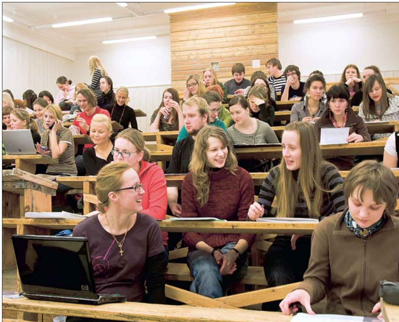
Uued vastuvõttureeglid tõid eelmise aastaga võrreldes kolmandiku võrra rohkem juurde neid noori, kellel on huvi enda kõrgharidus just Tartu Ülikoolist omandada.