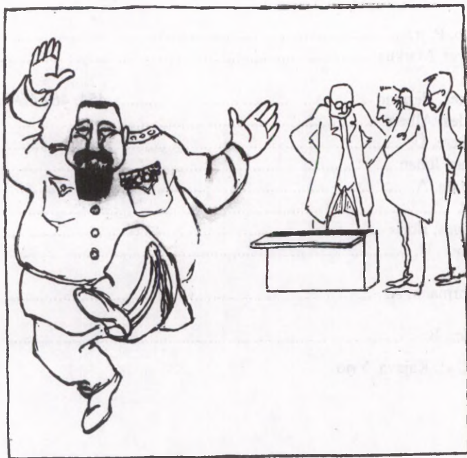
Kunstnik: K.A.Hindrey ? Kratt. 1925. Nr.9.