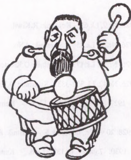
Kunstnik: K.A.Hindrey. Hoia Ronk. Kaasaegsed. 1926. Lk.33.