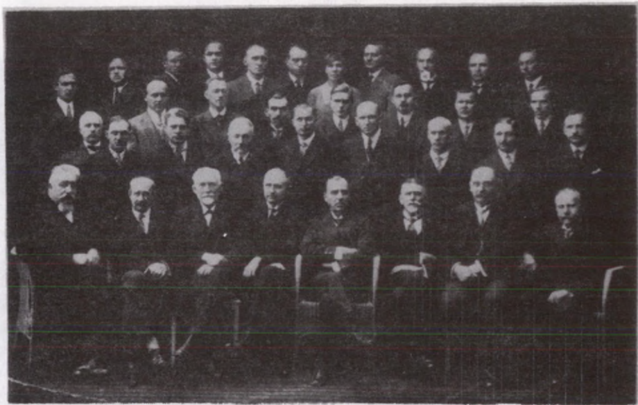
Tartu Ülikooli arstiteaduskonna kogu. 1929.a.