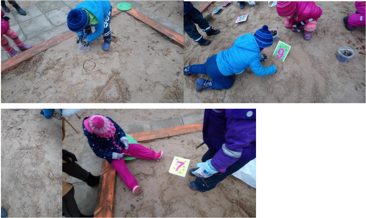
Pilt 8-18. Piltidel on Sillamäe L/a Pääsupesa, rühm „Piilud“ 4-5 aastased lapsed. Õuesõpe, matemaatika tund. Laste pildistamiseks luba küsitud.