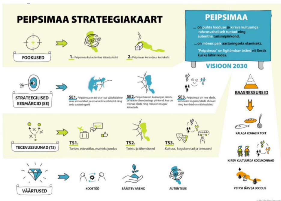
Joonis 1. Peipsimaa strateegiakaart (Allikas: Peipsimaa arengustrateegia 2019- 2030, lk 10)

Et liikuda Peipsimaa visiooni poole tuleb panustada Peipsimaa mainekujundusse ning arendada turismi ja ettevõtlust kogu piirkonnas. Samuti tuleb koostöösse kaasata kogukonnaliikmeid ning toetada omaalgatuslike tegevusi, mis aitab luua piirkonnale lisandväärtust, sh uued teenused, töökohad. Vajadust nähakse ka giidide koolitamiseks ja rakendamiseks. (Peipsimaa... 2018, lk 11)