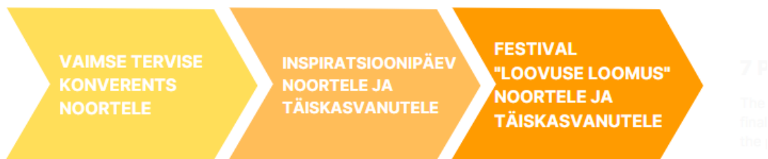
Joonis 1. Sündmuse kujunemine.

Sündmuse nime leidmisel oli oluline, et nimi annab edasi sõnumit sisu kohta. Erinevatest variantidest jäi pinnale “Loovuse loomus”, milles on veidi sõnamängu ja samas ülevaadet sisust. Kokkuvõtteks oli kujunemise käigus valminud idee loovuse festivalist, mis on suunatud noortele ja täiskasvanutele, kes soovivad oma ellu tuua suuremal määral loovust ning leida ühiskondlikult keerulises ajas värsket hingamist ja inspiratsiooni.