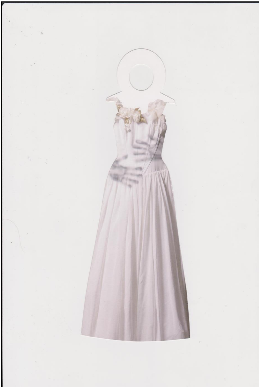
Fiktiivabielude vastane kampaania 2012 (1).