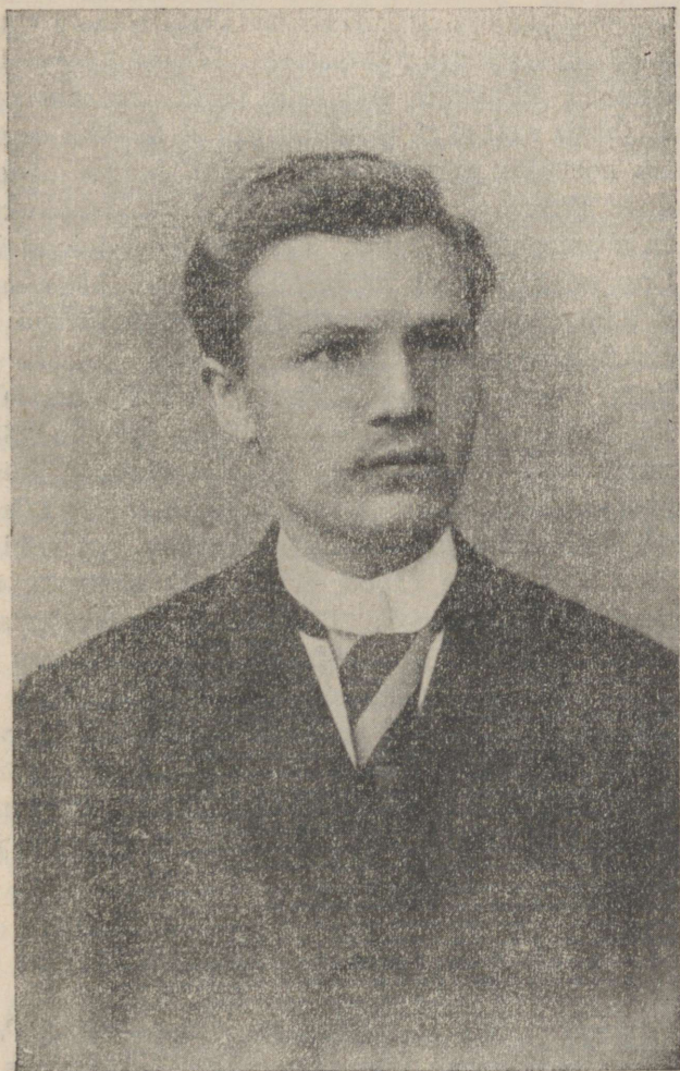
Juhan Liiv noorena.