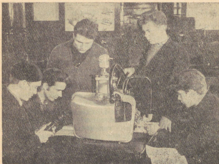
Järva-Jaani Maakutsekooli nr. 31 õppetöökogas.

«Poisid lõpetavad kooli ja lähevad tööle. Meie maal aga areneb üha enam sotsialistliku võistluse kõrgeim vorm — kommunistliku töö liikumine. Tahame, et meie tulevased