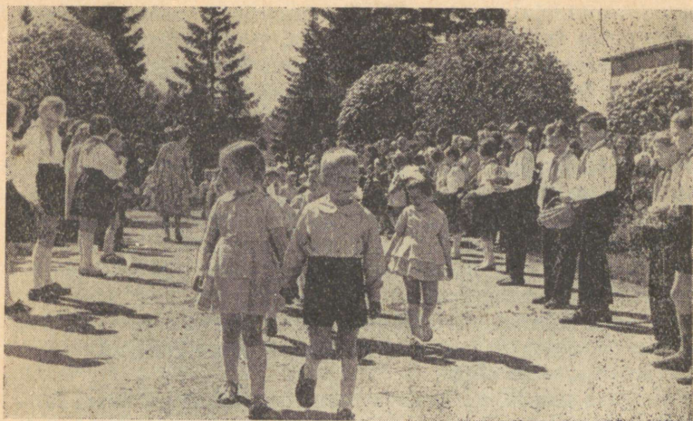
Laste kevadpäevad Türil 1962. aastal.

Nõupidamisele järgnenud päeval pandi Türi linnas üles kuulutused: