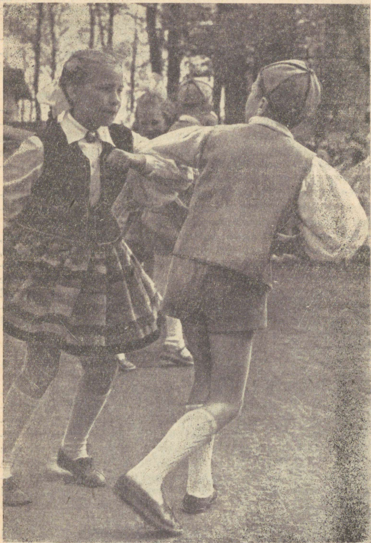
Türi kultuurimaja laste-rahvatantsurühm.