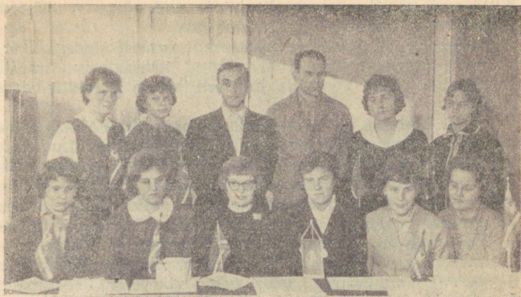
Paide «Jõu» korvpallinaiskond.

vastu saa! See kõik oli juhus. Mis treeningut Paides teha saabki! Küll näete — saavad veel «lakkida» nii et aitab!»