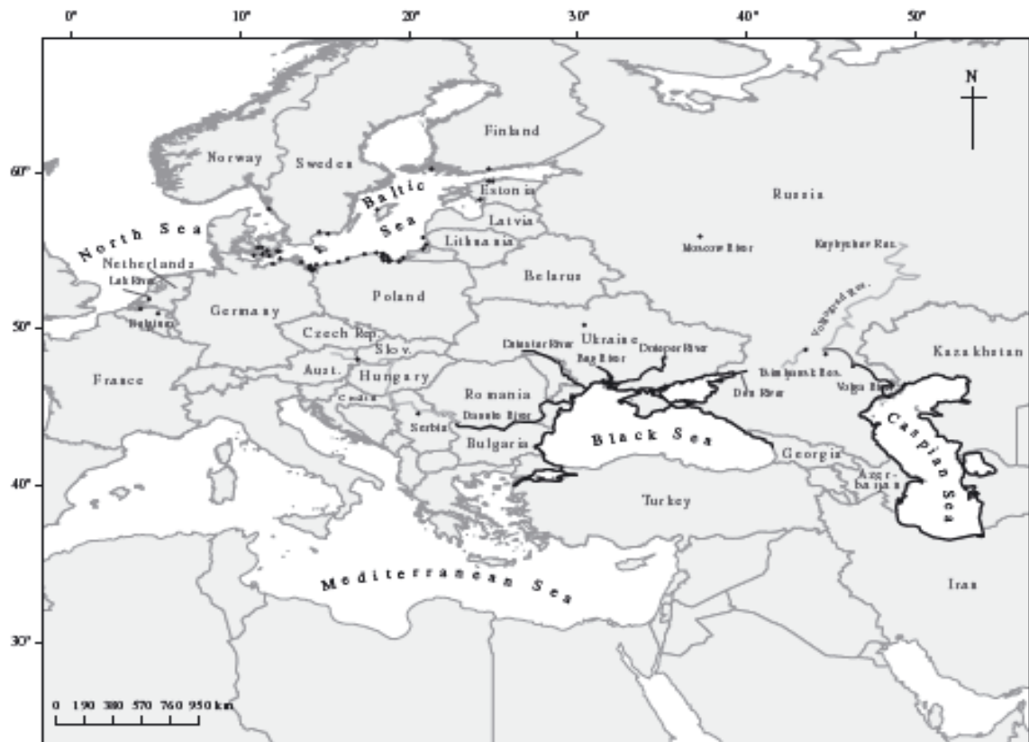
Lisa 1. Ümarmudila levik Ponto-Kaspia vesikonnas ja Euroopas (Kornis et al. 2012)