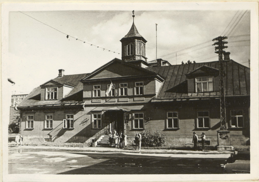
Valgamaa TSN Täitevkomitee hoone, kus alustas oma tööd Valgamaa operatiivgrupp.