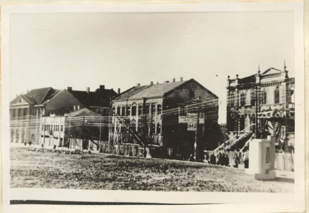
Artelli "Ühiskasu" taastatav hoone Valga kesklinnas (paremalt teine) 3