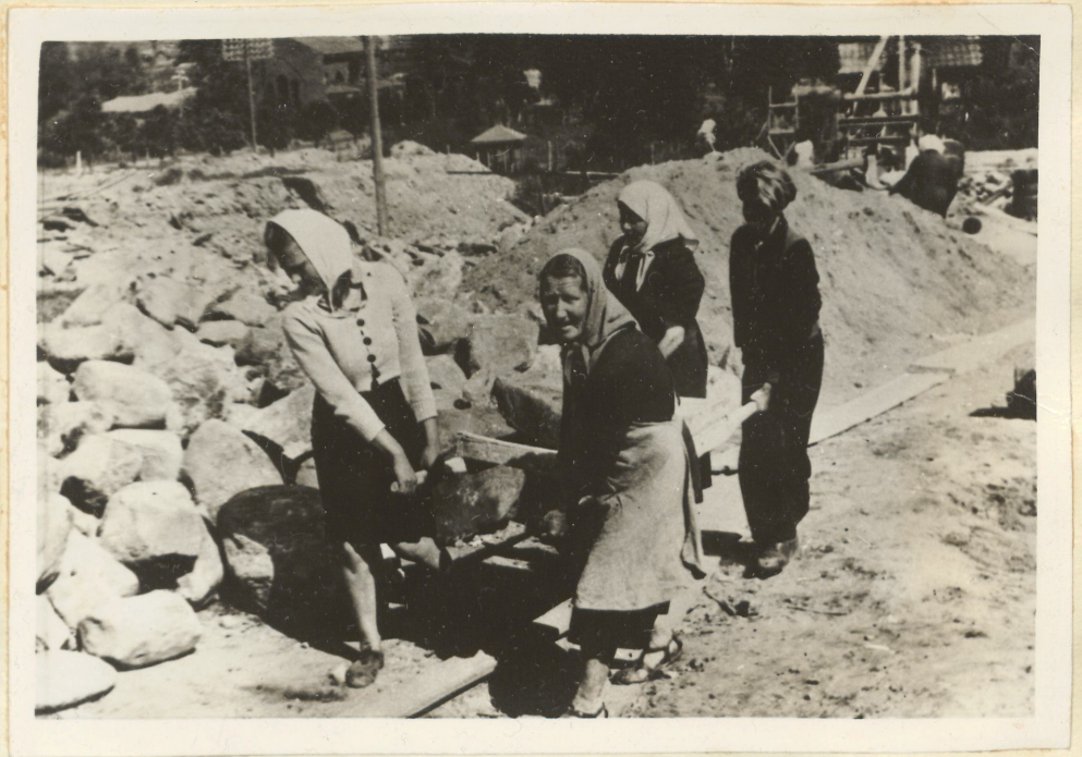
Taastamistööd Valga linnas.