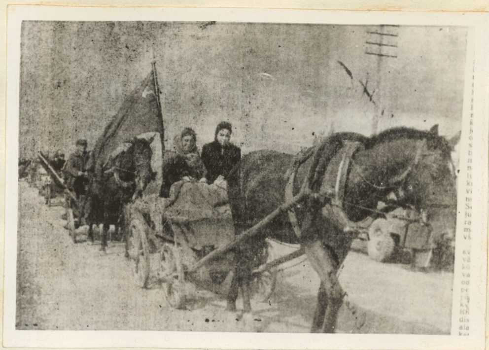
Esimene uudsevilja viimine riigile punavooris Põdarala vallas 1945. a. augustis