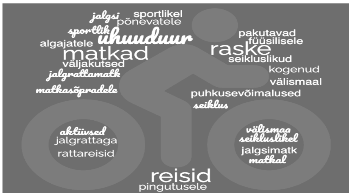
Joonis 2. Intervjueeritavate märksõnad viimasele intervjuu küsimusele

Puhkuse veetmise võimaluste otsimiseks, eelistasid vanemad vastajad (N52, N62, M66, M68) saada infot tuttavatelt ja sõpradelt, usaldades nende soovitusi ja kogemusi, kuid koduleht oli vajalik täpsema informatsiooni saamiseks. Nooremad vastajad (N40, M43, N45, N48) aga eelistasid lisaks sõprade soovitudele otsida esimest teavet internetist erinevate turismifirmade kodulehtedelt. Nad tõid esile vajaduse saada mitmekesist ja usaldusväärset teavet ning leidsid, et internetist saadav teave aitab neil paremini planeerida ja otsustada, milline puhkusevariant neile kõige paremini sobib. Intervjuude lõpetuseks saime teada vastajate märksõnad &Moments OÜ ettevõtte kohta.