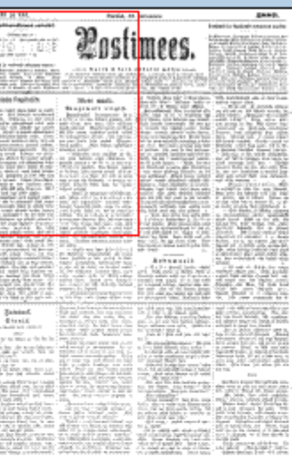
ajalehes koos nr. 143 ja 144