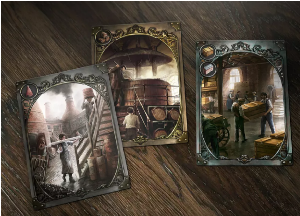
Joonis 2. Brass: Birmingham kaardid. Kaardid sümboliseerivad erinevaid tööstuslikke tegevusi ja mängijate kui ettevõtjate perspektiivist ärivaldkondi ja kasumivõimalusi. Kättesaadav : https://boardgamegeek.com/image/3500869/brass-birmingham

Vastavalt kapitalismi erinevatele elementidele ning lauamängude olemusele olen valinud erinevad kapitalismi tunnusmärgid, mis võivad viidata kapitalismi ja lauamängude ühisosale. Sellised tunnusmärgid on peamiselt seotud mängu reeglite ja mehaanikatega, kuna töö eesmärk on analüüsida tunnusmärke, mis esmapilgul välja ei paista.