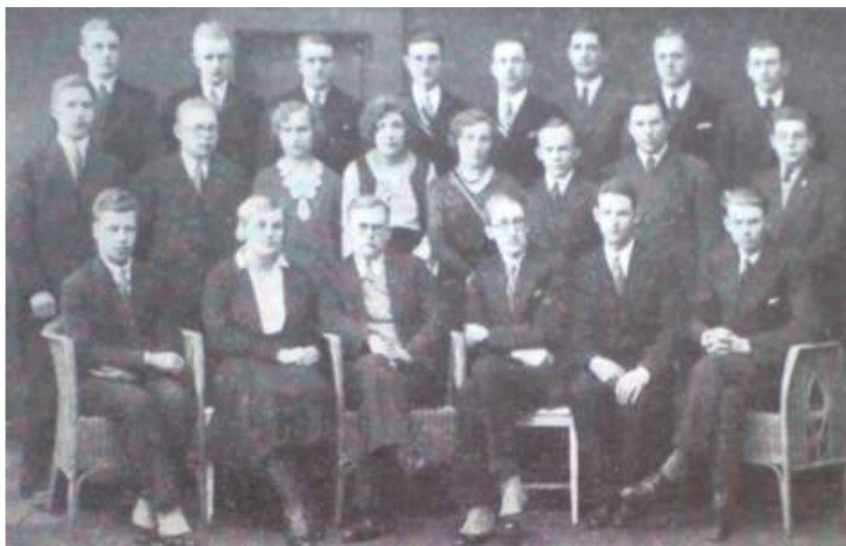
Allikas: Üliõpilasleht 3 / 1932, lk 47.