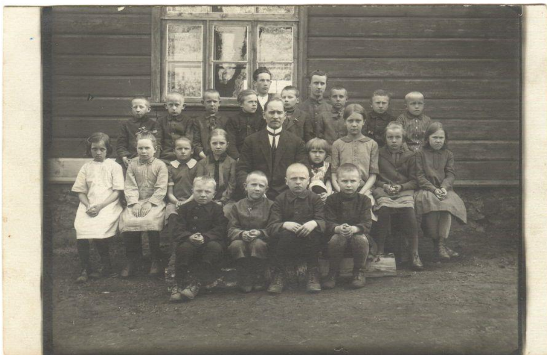
Pilt nr. 12 Koruste algkooli III klass ja koolijuhataja 1928. aastal. 293