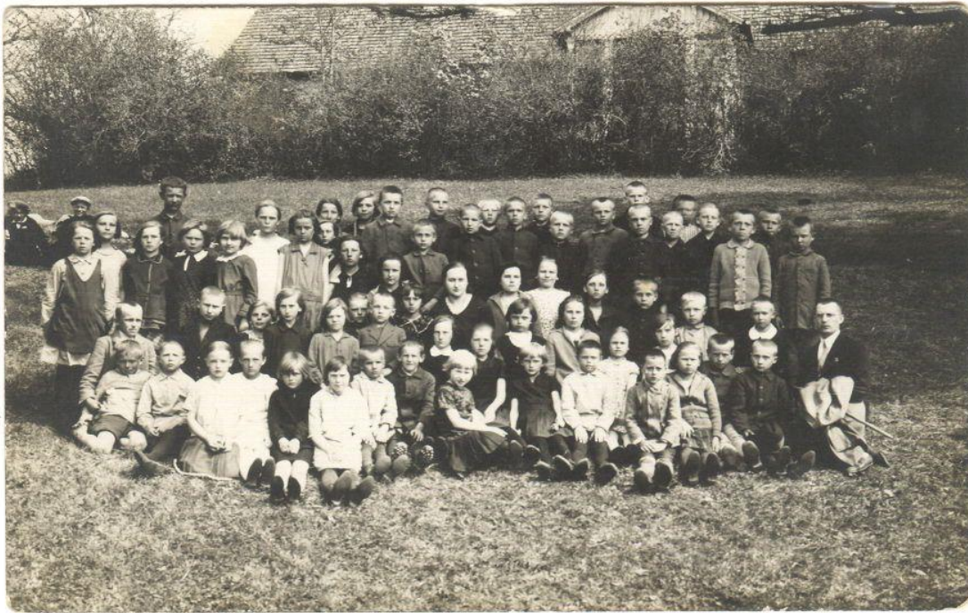
Pilt nr. 7. Rõngu 6. Klassilise algkooli õpilased 1931. aastal 288