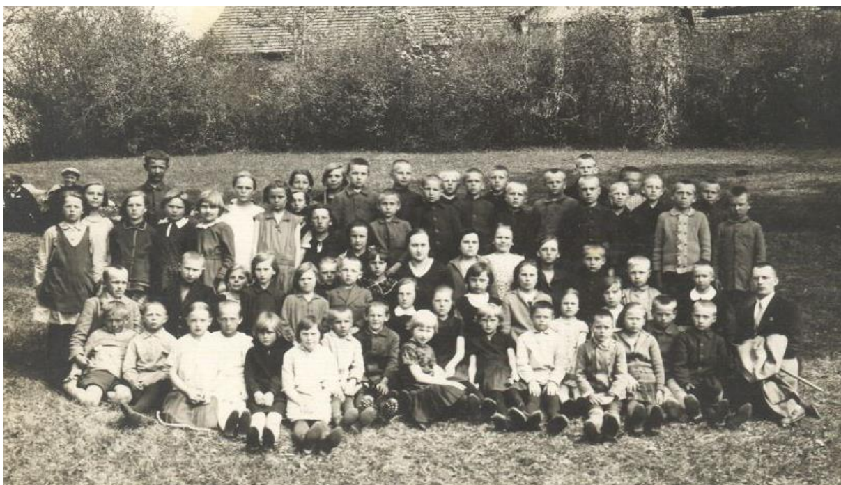
Pilt nr. 5. Rõngu 6. klassilise algkooli õpilased. Pilt on tehtud eeldatavalt saksa okupatsiooni ajal, kuna siis kandis asutus just sellist nimetust. 286