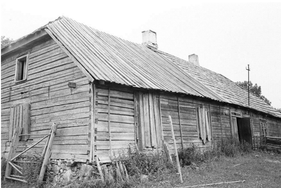
Pilt nr. 10. Kunagine Raigaste kooli hoone. Foto on tehtud aastal 1960. 291