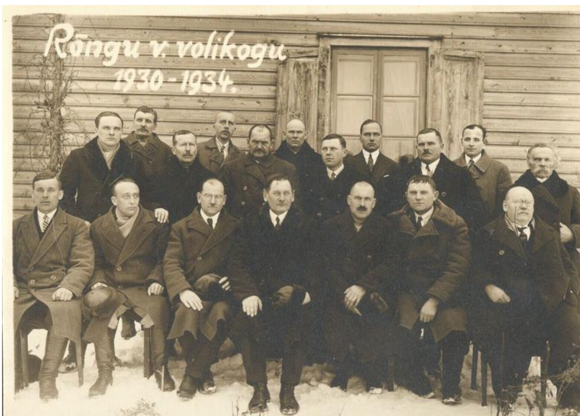
Pilt nr. 6. Rõngu valla volikogu 1930-1934. 287