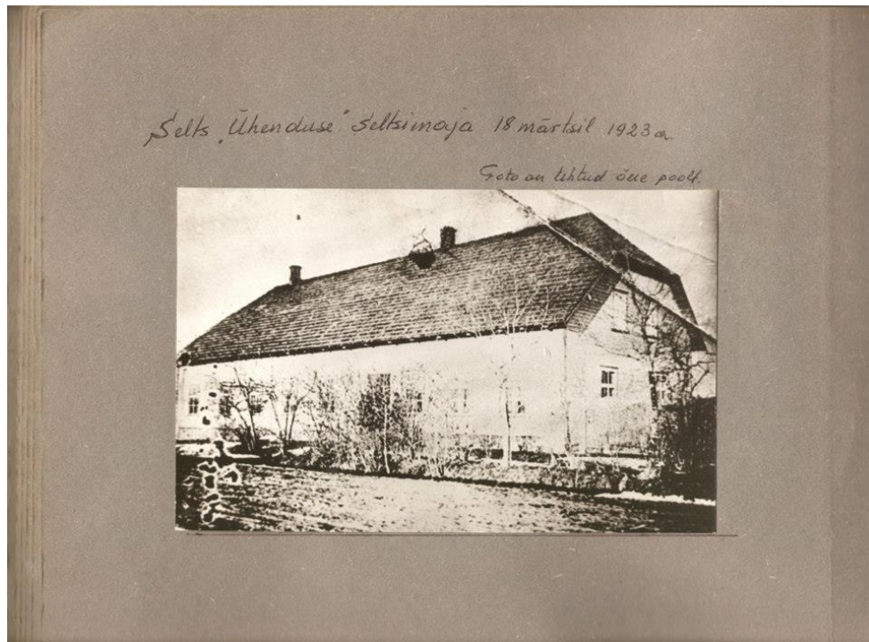
Pilt nr.1. Rõngu valla selts „Ühendus“, 16. märts 1923.