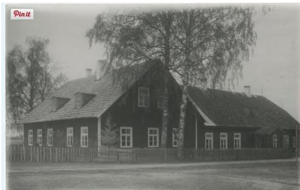
Pilt nr. 4. Rõngu kool 1940. aastal. 285