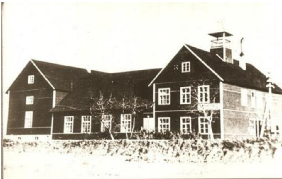
Pilt nr. 3. Rõngu rahvamaja 1935. aastal