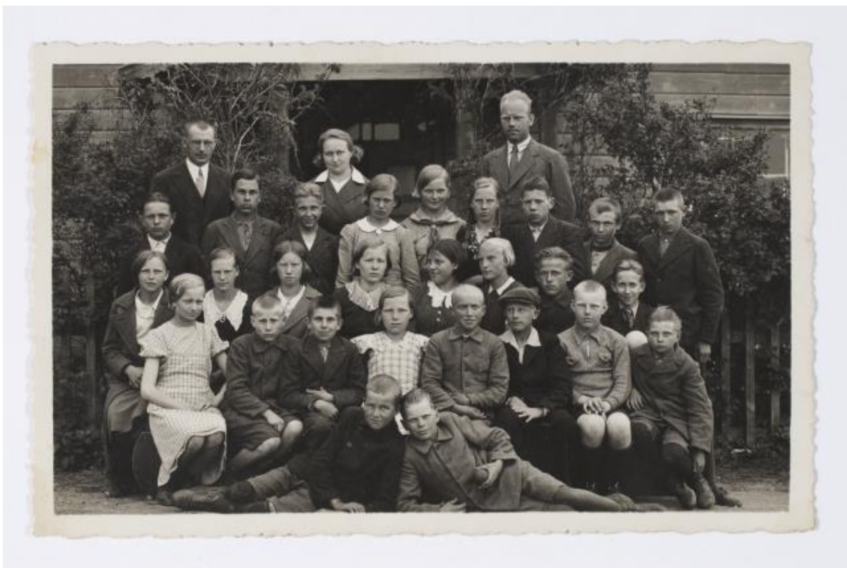
Pilt nr. 8. Rõngu algkooli V-VI klass 1937. aastal 289