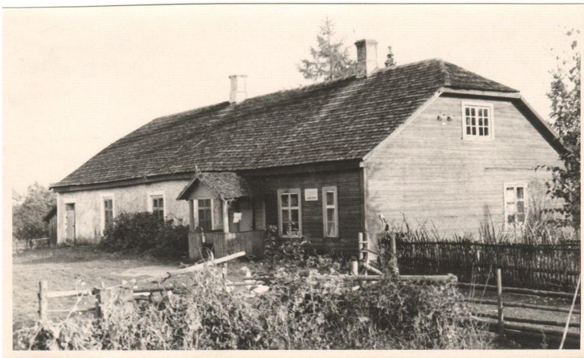
Pilt nr. 9. Kirepi kunagine koolihoone. Dateering teadmata. Autor Kirt Kaljola. 290