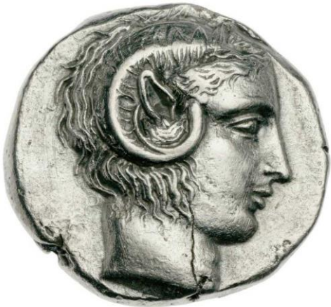
Metapontioni stater Apollon Karneiose kujutisega, 430–410 e.m.a. Museum of Fine Arts, Boston. Kättesaadav (28.04.2022): https://collections.mfa.org/objects/1249/stater-of-metapontion-with-head-of-apollo-karneios?ctx=fcb9b10a-d30b-4e01-ba14-66c4c6dc7f41&idx=0