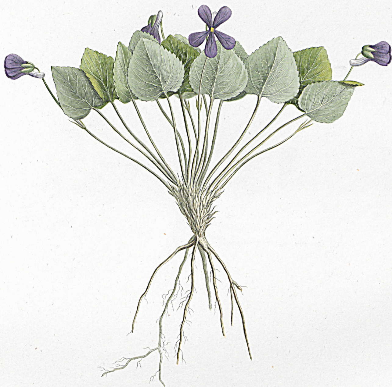
Viola macroceras .