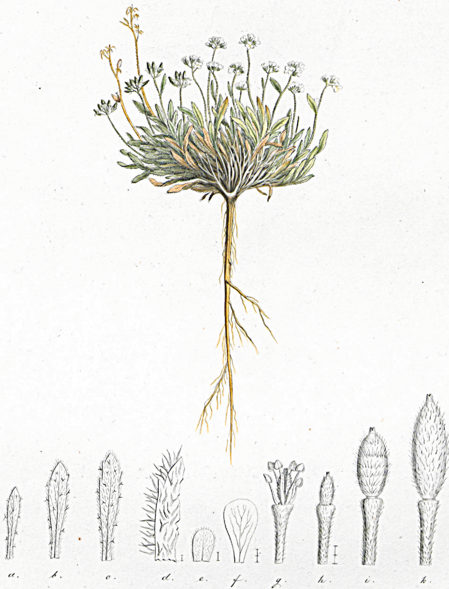
Draba rupestris \beta altaica .