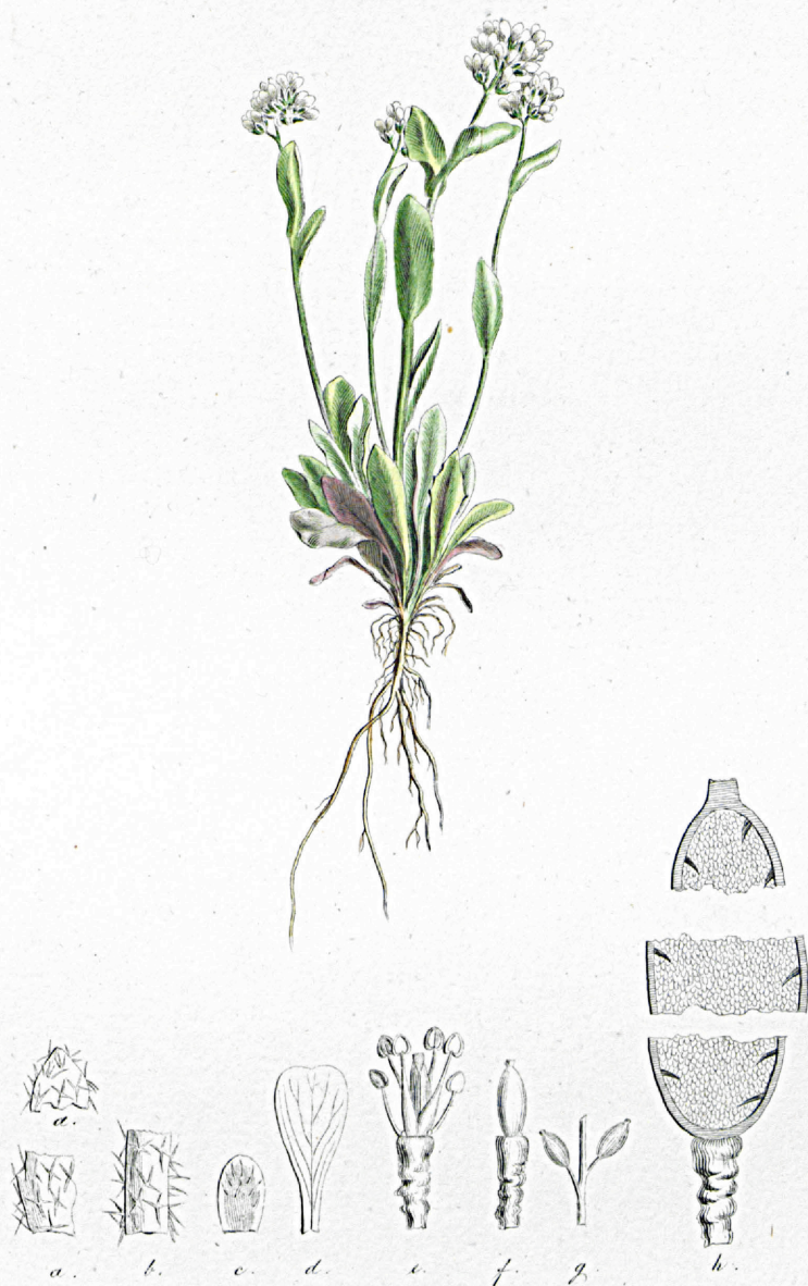
Draba subamplexicaulis .