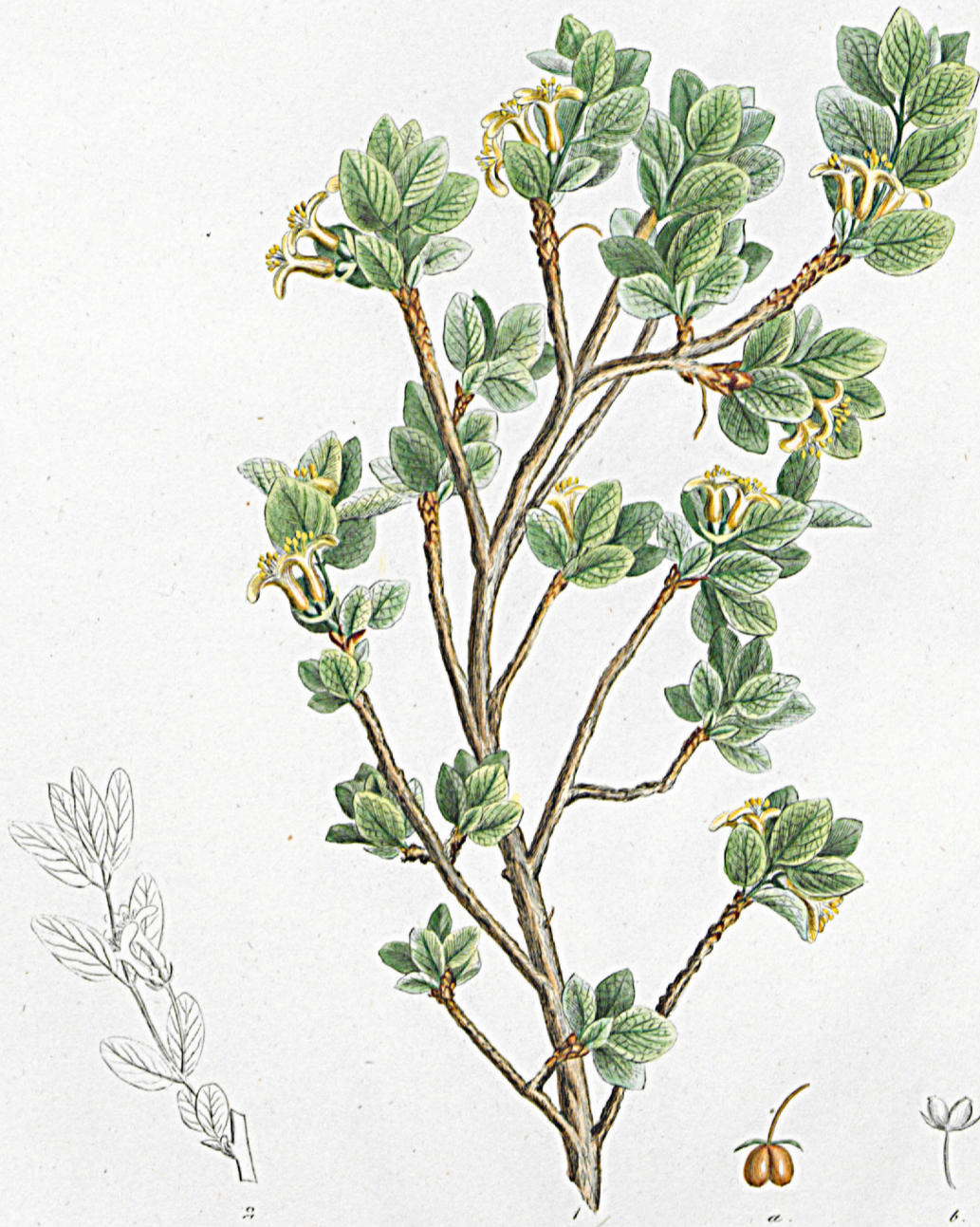
Lonicera microphylla .