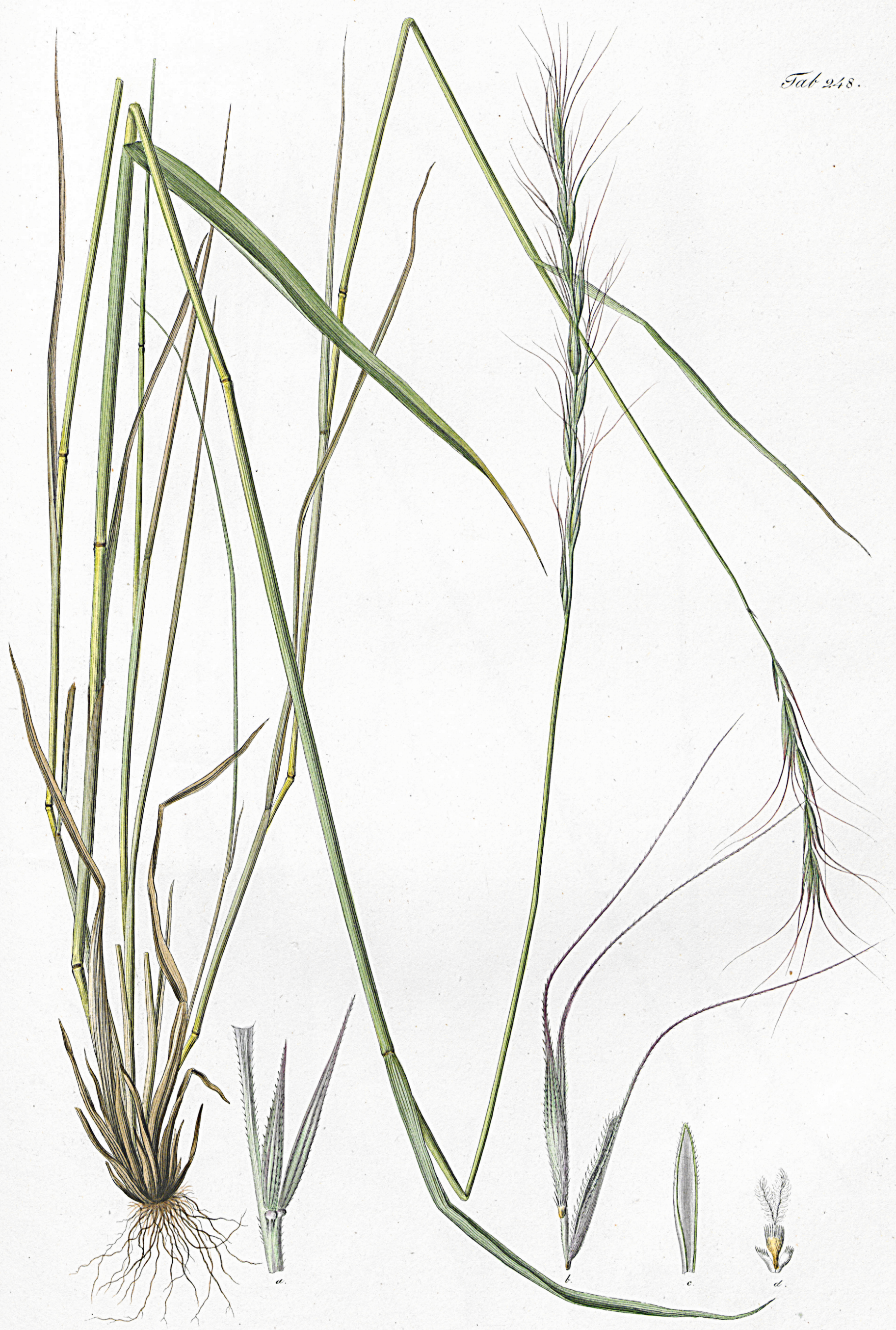
Triticum carinatum, var. Gmelini.