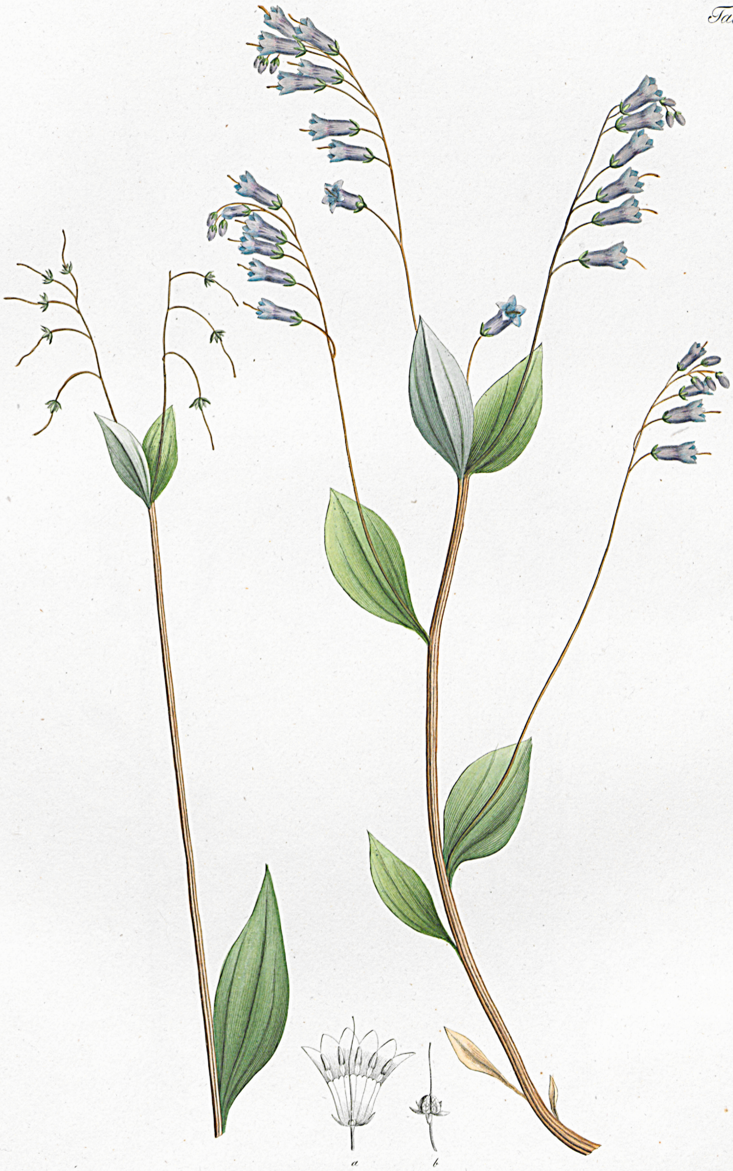
Lithospermum sibiricum .