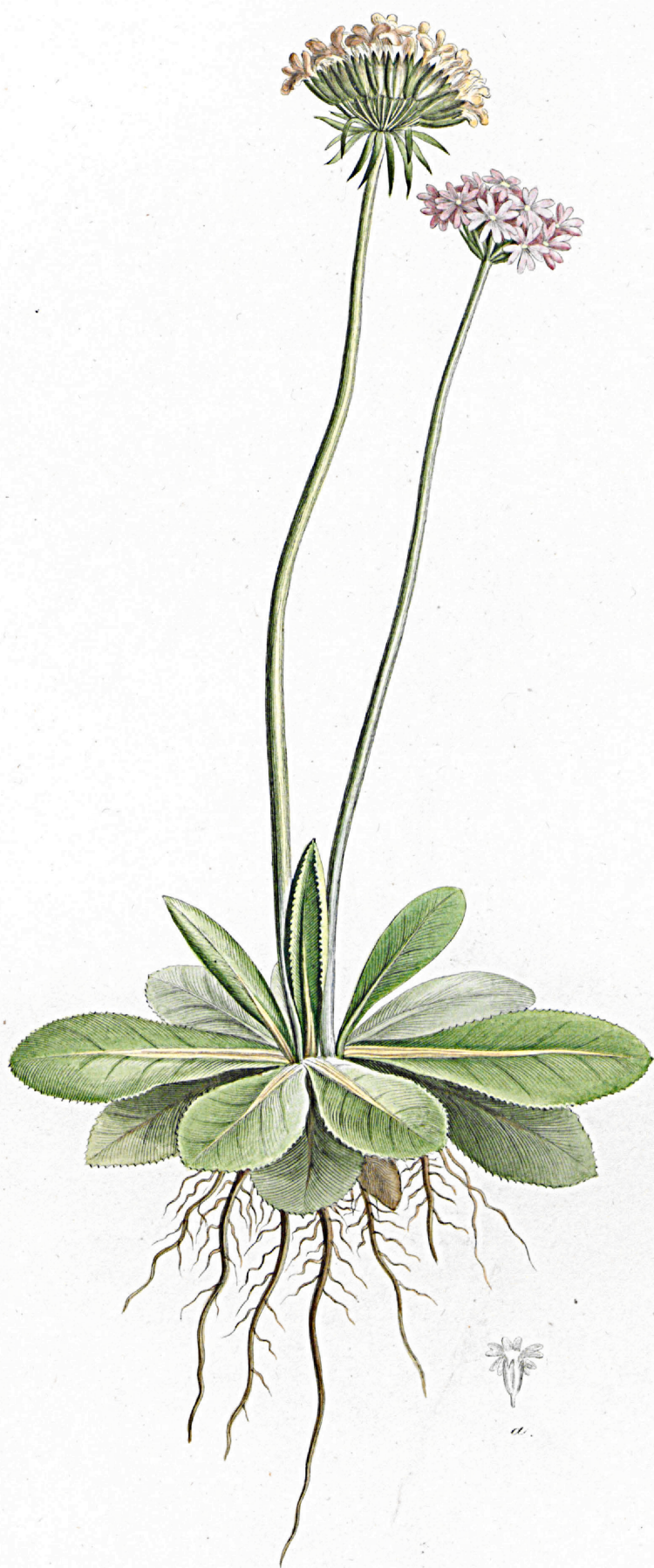
Primula auriculata .