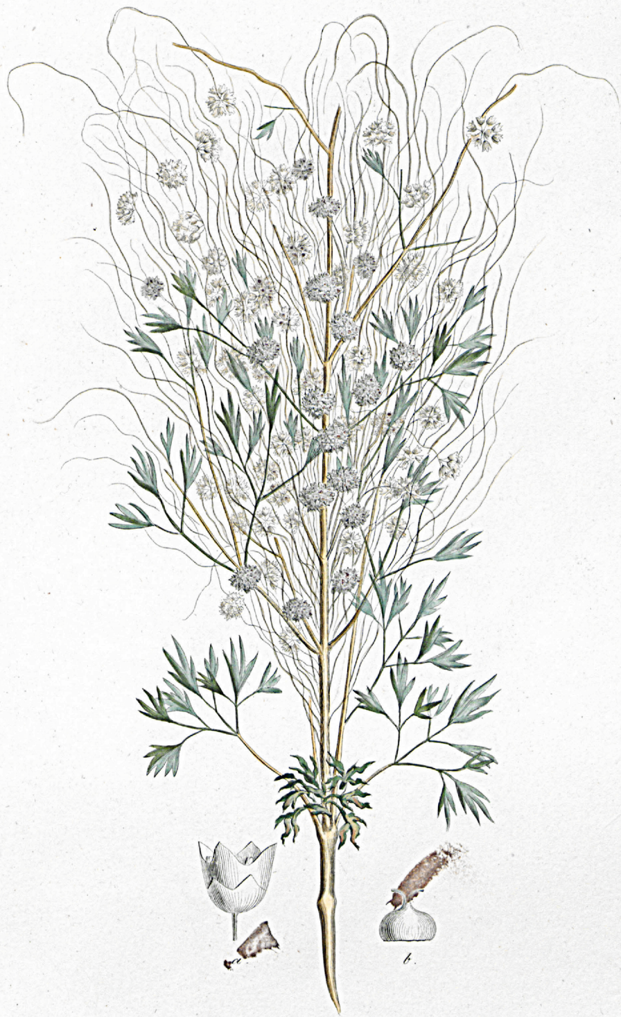
Cuscuta pedicelata .