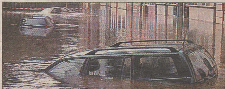
Praha oli vaid üks linnadest, mis sarnanes sel suvel Veneetsiaga, sest liiklus pidi käima enamasti veeteed mööda.

Paistab, et USA paljudes osariikides on põud tugevam kui meil: Colorados on aiakastajatele ette nähtud aretid ning kõvad trahvid.