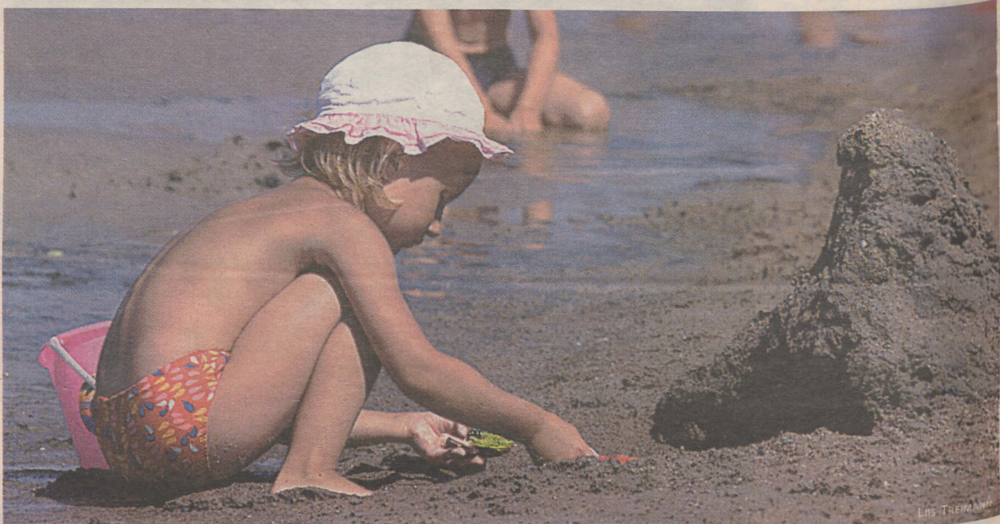
Eesti põngerjad said sel suvel rannas isu täis mängida, sest kõrvetav kuivus sundis nende vanemaid nii tihti kui võimalik randa kiirustama.

Kolmevõistluses, st kolme kuu kokkuvõttes jäi tänavune puhkajate unelmate suvi pala-