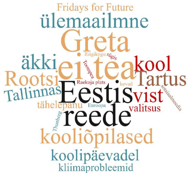
Joonis 2 Sõnapilved vene ja eesti emakeelega noorte teadmistest kliimastreikide kohta

Venekeelsetest noortest oskasid pooled ise streikide kohta jutustada, kaks vastanut jäid streikidest rääkimisega hätta ja üks noortest ei teadnud, millest juttu on. Kui autor küsis abistavaid küsimusi ja mainis Greta Thunbergi nime, teadsid enamik, et ta oli korraldanud proteste keskkonna- või kliimateemadel. Selgelt tuli välja see, et Tartu venekeelsed noored teadsid temast tunduvalt rohkem kui Tallinna noored. Kõik tartlased teadsid, et streigid algatas Greta Thunberg, need on levinud üle maailma ja jõudnud ka Eestisse. Samuti teati, et protestidel osalesid kooliõpilased, kuid keegi ei maininud, et streigid oleksid toimunud korduvalt, reedeti. Tallinna noortest kaks intervjuueritavat seostasid Greta Thunbergi rohkem tema peetud kõnedega kui streikidega; neist üks ei olnud koolistreikidest midagi kuulnud, teine oli kuulnud Thunbergi seosest ka protestidega, kuid ei midagi rohkemat. Kolmas vene emakeelega tallinlane oli enam-vähem sama informeeritud kui tartlased ega maininud samuti streikide kordumist. Venemaa kliimastreike ei maininud ükski vene noor.