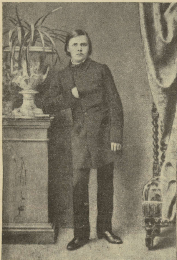
F. Nietzsche õpilasena Pfortas, napoleonlikus seisangus. Foto 1861. a. kevadest.