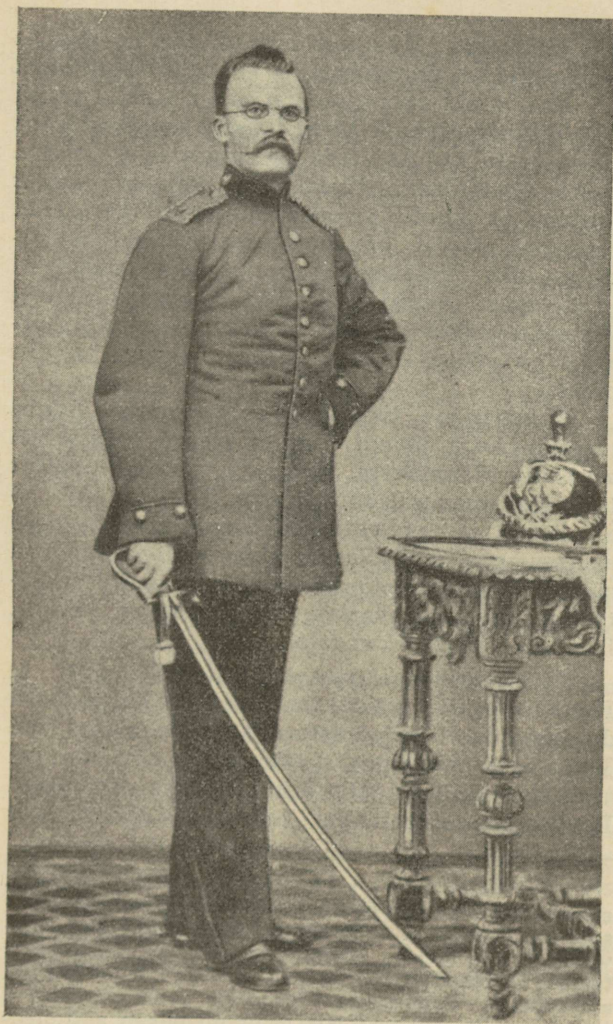
Friedrich Nietzsche. Ülesvõte sügisest 1868, sõjaväeteenistuse lõpust.