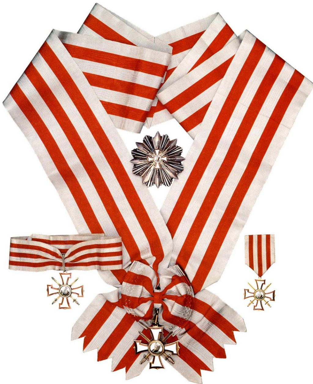
Lāti Karutapja orden (Lāčplēša kara ordenis)