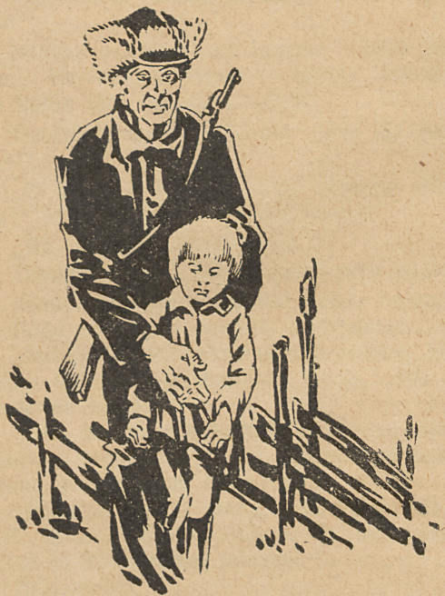
Ārni, jah Ārni. . . (Vt. lhk. 85.)