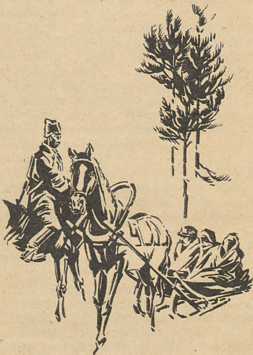
Kaarli võttis tundmatu tervituse vastu. (Vt. lhk. 55)