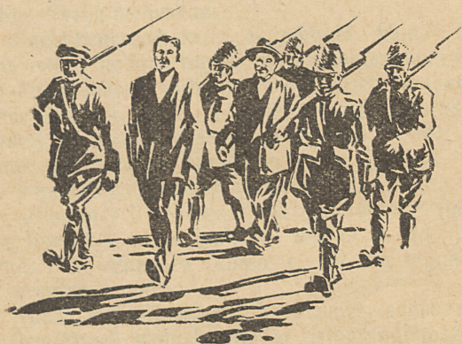
Talod viidi punaväelaste vahel Võrru. (Vt. lhk. 44.)