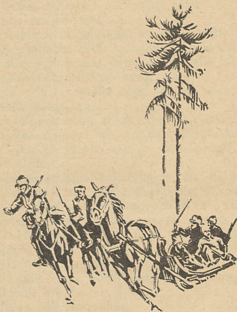
Peti jahti inimeste pääle. (Vt. lhk. 38.)