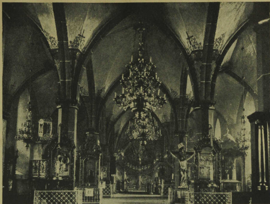
Endine Narva linnakirik, praegu apostliku õigeusu katedraal. — Narva forna stads- kyrka, nu rysk katedral. Tartu Ütikooli Kunstiajaloo Kabineti kogudest.

fragmendid peale selle näitavad roiete jälgi, tuleb siin ordu mõju- tus eriti silmapaistvalt nähtavale. Suured konsolid läänesinas on sama tüüpi kui Marienburgi kõrgmeisteri-palee suveremteris, ainult pisut lihtsustatud. Täiesti ordustiilis olid sihvakad kahek- sakandilised sambad, mis kandsid kergeid võlve. Samasse tüüpi kuulusid sambad, mis kandsid nunnaderõdu kiriku kirdenurgas. Kapiteelid on ketta ja kaheksandilise plaadiga — vorm, mida leidub paljudes ordumonumentides, teiste hulgas ka Marienburgis (sama tüüpi olid ka peasammaste kapiteelid; v. E. Kühnerti artikkel).