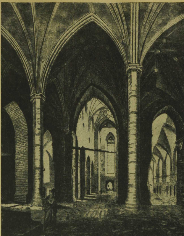
Tallinna. Oleviste kiriku koor p[ä]rast 1820. a. tulekahju. — Olaikirkan, Tallinn. Koret efter branden 1820. Litograafia Eestimaa Kirjanduse Seltsi kogudest.

kommer detta till uttryck i gaveln med dess blinderingar. Vad valven beträffar, har teglet här uteslutande kommit till användning — en i Tallinns arkitektur sällsynt företeelse. Då de bevarade valvfragmenten dessutom visa spår av ribbor kommer här ordensinflytandet särskilt frappant till synes. De stora konsolerna på västväggen äro av samma slag som de i sommarremtern i Marienburgs högmästarepalats, endast något förenklade. Helt i ordensstil voro de slanka åttkantiga pelarna, som buro de lätta valven. Av samma typ voro de pelare, som buro den för nunnorna avsedda läktaren i kyrkans nordöstra del. Kapitälerna här ha med sin ring och sin åttasidiga platta en form, som återfinnes vid flera ordensmonument, bl. a. i Marienburg. (Av samma typ voro även huvudpelarnas kapitäl; jmf. E. Kühnerts bidrag i denna publikation.)