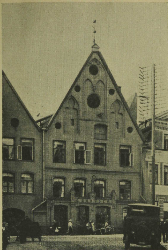
Güntheri ehk n.-n. piiskopi-maja Tallinnas. — Güntherska eller "biskopshuset" i Tallinn.

former, som redan börjat få tradition i Tallinn. Nikolaikyrkan, Olofskyrkan och troligen även domkyrkan voro vid denna tid hallkyrkor med enkla och nyktra om ock tyngre former än Pirita. Här såväl som i kyrkorna i Tallinns grannskap återfinna vi även gördelbågar med tillhörande konsoler av samma karaktäristiska typ som de i Pirita. Den närmaste förebilden i Tallinn för birgittinernas klosterkyrka torde dock ha varit dominikanernas stora tempel med dess tegelvalv och markerade längdriktning. Dominikanerkyrkan hade liksom Pirita en