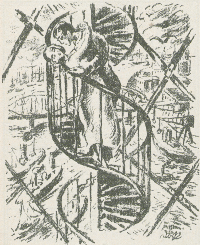
Dora Brandenburg-Polster Zeichnung zu Brandenburg „Das Zimmer der Jugend“.