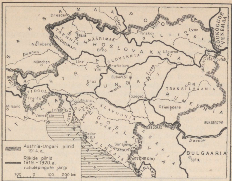
1. Austria-Ungari lagunemine.

seks sõjakäiguks Nõukogude Venemaa vastu osutus võimatuks vastuolude tõttu imperialistide endi leeris ja revolutsioonilise liikumise tõttu Läänes. Lloyd George'i tunnistuse järgi oleks «sõda bolševike vastu... organiseeritud tööliste hulgas esile kutsunud niisuguse liikumise, mida on raske isegi ette kujutada». Kuid Pariisis võeti vastu otsused abi osutamise kohta valgekaartlikele kindralitele, siit sai alguse kodusõda, mis tõi Nõukogude Venemaa rahvastele loendamatu kannatusi. Imperialistid suunasid löögid Nõukogude Ungari vastu.