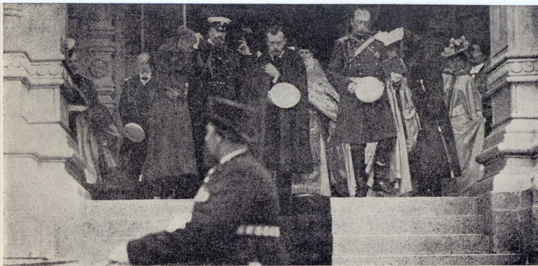
NIKOLAI II väljub Tallinna Toompea katedraalist. (Pilt mälestusteseerias ilmunud A. V. Bellegarde'i teosest.)