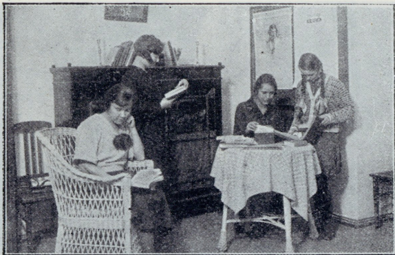
Esimesed ühingu ruumid, „Klubituba“.

Demonstratsioon börsi saalis „Kasutub laud“.