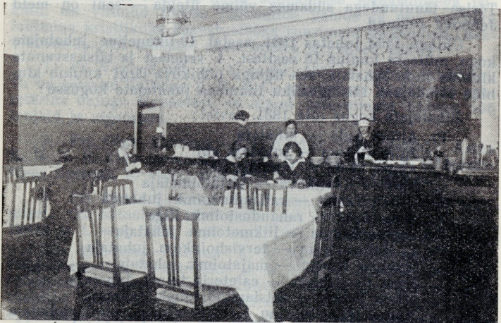
Ühingu einelaud „Cafeteria“.