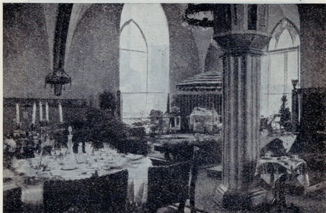
Demonstratsioon börsi saalis „Kaetud laud“.