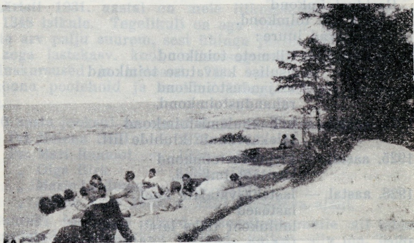
Konverentsi rühm Udria rannas.

VIII. 1930. aastal Udrias. — Teem: Kristlikkus isiku, pe- rekonna ja rahva elus.