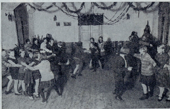
Laste mängurühm Balti Puuvillavabrikus.