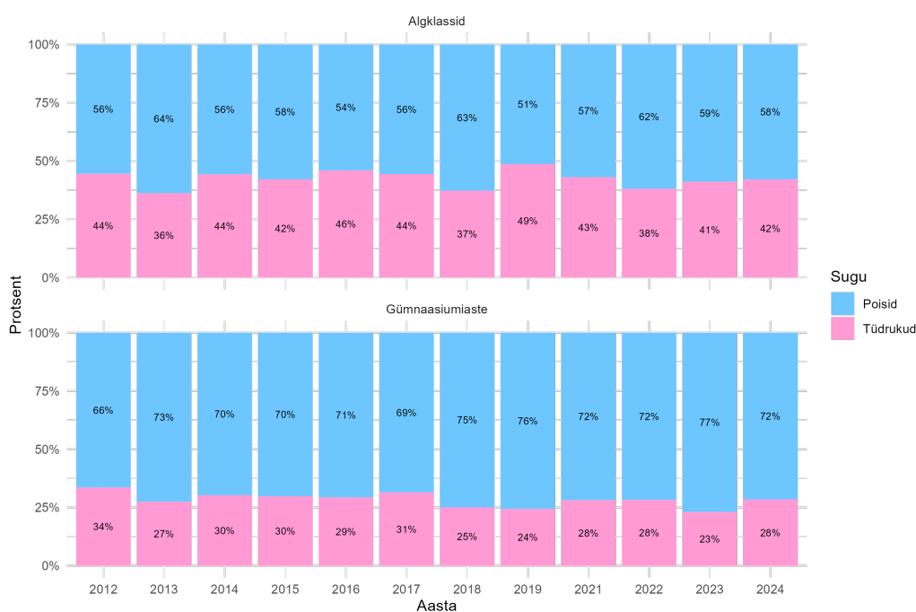
Joonis 1: TOP 200 hulka kuulunud osalemiste sooline jaotus algklassides ja gümnaasiumiastmes aastate lõikes.

Kogu valimi lõikes moodustavad poistest osalemised 63,57% ja tüdrukutest 36,43%, mis viitab sellele, et poisid on TOP 200 hulgas selgelt ülesindatud. Kui seda jaotust vaadata aastate lõikes, siis selgub, et tegemist ei ole üksikute aastate eripäraga, vaid püsiva mustriga.