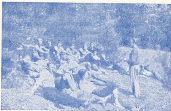
Loeng juhtidele vabas looduses.

Helme kog. õpetaja. Tõrva N. M. K. Ü. esimees.