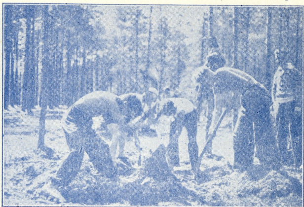
Sport ja töö karastavad keha.