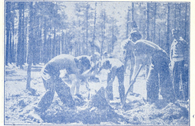
Sport ja töö karastavad keha.

Saatke oma poeg tema rahutumas poisieas N. M. K. Ü-esse ja teie ei muretse enam selle pärast, millele ta vastu läheb.