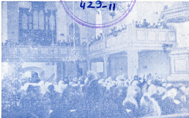
N. M. K. Ü. jumalateenistus Helme kirikus.

Arendada usulise, mõistusliku, seltskondliku ja kehalise kasvatuselise abil kristlikku iseloomu ja ligimese teenimist noorte ja täisealiste meeste peres.