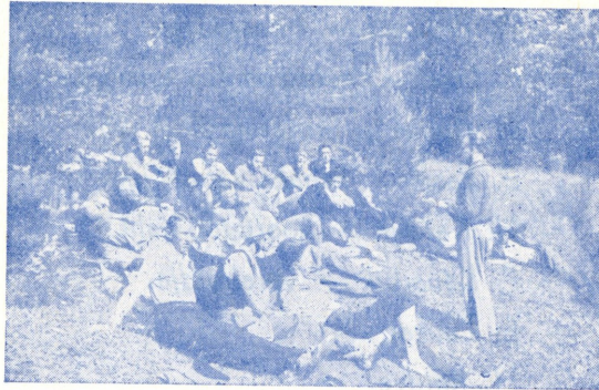
Loeng juhtidele vabas looduses.