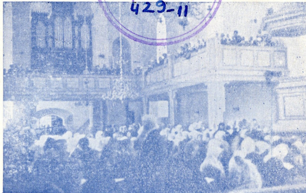
N. M. K. Ü. jumalateenistus Helme kirikus.

PT Arendada usulise, mõistliku, seltskondliku ja kehalise kasvatuse abil kristlikku iseloomu ja ligimese teenimist noorte ja täisealiste meeste peres.