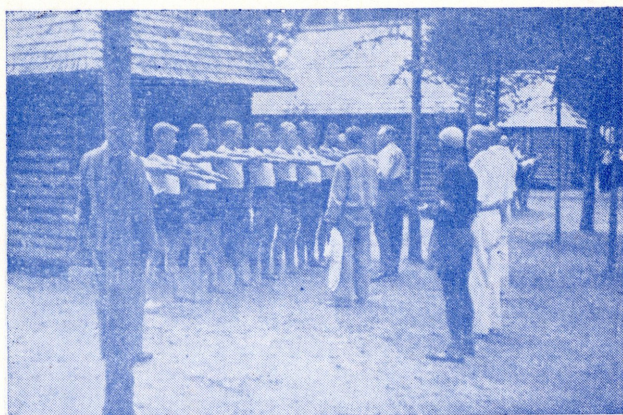
Tõrva N. M. K. Ü: noored Koitjärve laagris. Hommikune ülevaatus.

Kui tahame, et meie linna noortest kasvaksid tublid mehed, peame neile võimaldama kindlat iseloomu arendavat tegevust vabal ajal.