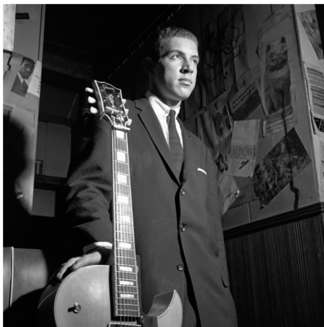
Joonis 1 "Kenny Burrell at the Five Spot 1959"

Kenny Burrell (joonis 1) kuulub maailmas enim lugupeetud jazzmuusikute hulka. Ta on olnud aktiivne ja järjepidev artist (helilooja, produtsent, soolokitarrist, ansambliiliige, bigbändi- ning sümfooniaorkestriiliige jm) alates 1950ndatest kuni tänapäevani. Märkimisväärselt pika karjääri jooksul on ta teinud koostööd pea kõigi tuntud jazzmuusikutega (Louis Armstrong, Dizzy Gillespie, John Coltrane jpt) ja ka teiste stiilide esindajatega (Ray Charles, Ray Brown jt). Oma nime alt on Kenny Burrell välja andnud üle saja albumi ja teiste muusikute juhitud kollektiividega lausa mitusada. Alates 1996. a, lisaks muusikuks olemisele, töötab Burrell professori ning jazzmuusika osakonna juhina California Ülikoolis Los Angeleses. (UCLA 2016)