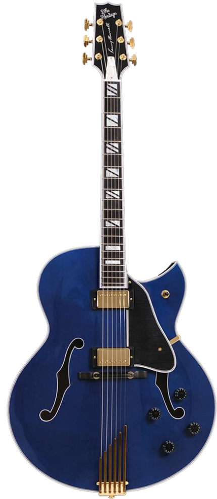
Joonis 3 Heritage Super Kenny Burrell (HG 2016)