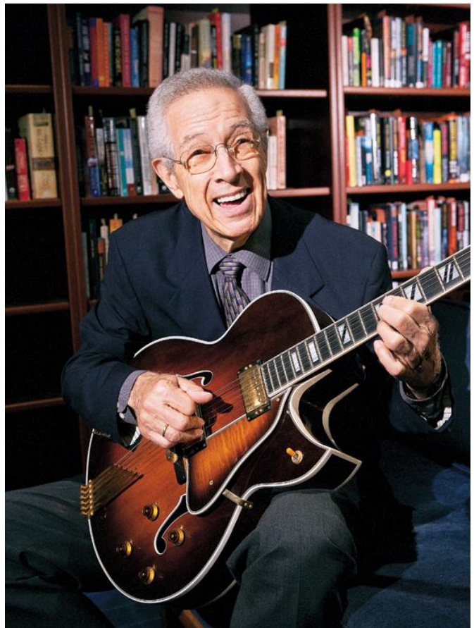
Joonis 2 Kenny Burrell (Marshall 2014)

Pika karjääri jooksul nii muusiku kui pedagoogina on Kenny Burrell (joonis 2) pälvinud lugematul arvul auhindu ning tunnustusi. Hoolimata sellest, et nad kunagi koos ei salvestanud, olevat Duke Ellington väitnud, et Burrell on tema lemmikitarrist. Ka bebop 'i-pioneer Charlie Parker olevat Kennyt kiitnud, väites: „Jah, mees, sa kõlad hästi!“ (Musto 2008). Muusikakriitikud ja kuulajad on teda korduvalt valinud „parimaks kitarristik“ („Best Guitarist“), viimati sai ta (teistkordselt) selle au osaliseks JazzTimes International ajakirja lugejate hääletuse järgselt (AAJ 2016).