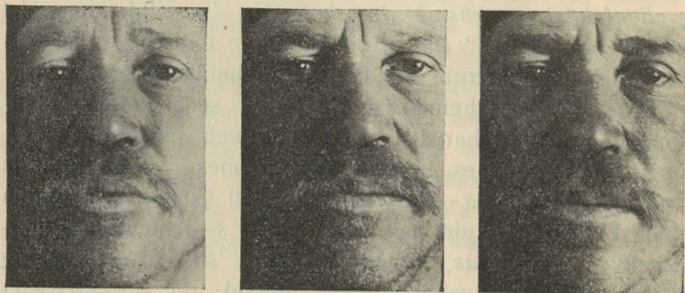
Pilt nr. 2.

On üldine nähtus paljudes keeltes, et foneem võib kanda eri varjundit ümbruse järgi. Näiteks on vadjas, eestis, saksas jne. k vägagi erinev ühendeis aka , uku , iki . Vadjas on aga käesoleval juhul tegemist enam omaette häälikumuutusega kui vaid ümbrusest tingitud varjundiga. Kõrisõlme hõn-gushäälikust on arenenud bilabiaalne ahtushäälik, nagu ana-