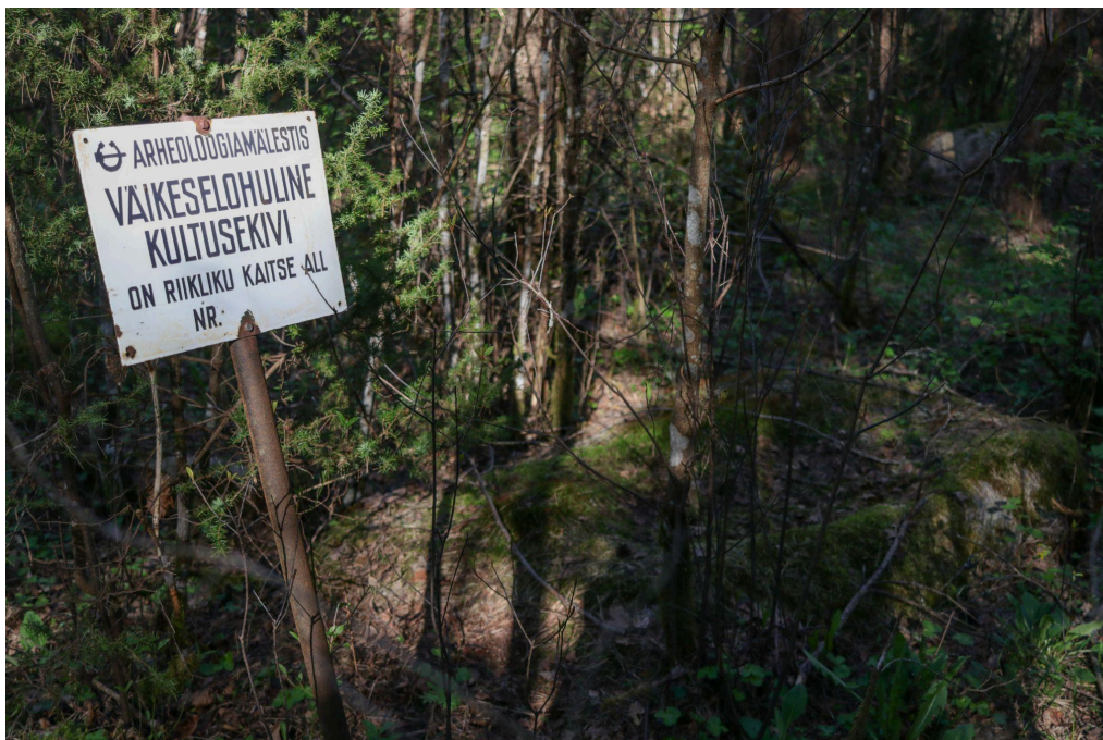
Foto 3. Salu ohvrikivi.