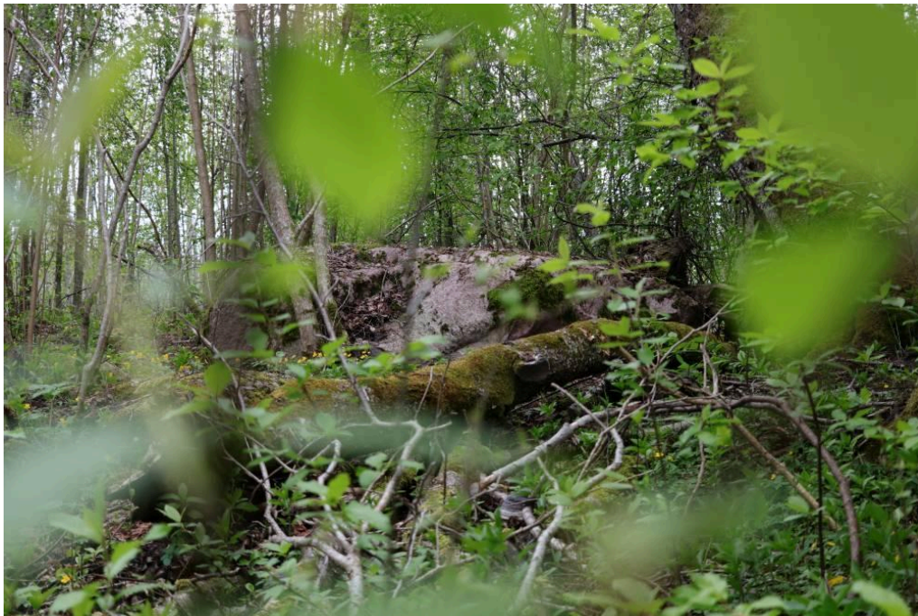
Foto 4. Võhksa nõiakivi.

Võhksa nõiakivi oli kasutusel arstikivina, kus haiged käisid abi otsimas. Selleks viidi kivile raha ja muid ande (ERA 233, 222). Ravimiseks kasutati vett, mis oli kivi peal olevates lohkudes (ERA 233, 243). Nõiakivi kohta käiv pärimus on kirja pandud kahelt informandilt ühel ja samal ajal, kuid huvitaval kombel mainib neist esimene leheküljel 222, et paika enam ei kasutata ja teine leheküljel 242, et paik on veel praegugi [aastal 1959] kasutusel.