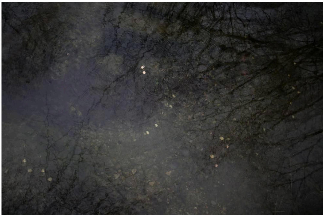
Foto 5. Rahaallika põhjas nähtavad annid. Erakogu.

Veekogusid ja eriti allikaid on Eestis peetud olulisteks pühapaikadeks. Allikaid usuti olevat mitut sorti, enamasti raviomadustega. Sellistesse allikatesse ohverdati hõbedat jms (Kultuurimälestiste register, 2023). Ariste rahaallikat on peetud ka silmaallikaks - visates allikale anni ja seejärel allikaveega haiget kohta pestes sai inimene terveks (ERA 233, 320). Allikast aga ei tohi midagi välja võtta, sest siis saad teise inimese haiguse endale (ERA 233, 249).