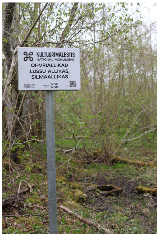
Foto 1. Lussu allikas.

Valjala kihelkonna Väkra küla ümbruskonda võib pidada looduslike pühapaikade osas üheks erilisemaks Eestis. Väikesel maa-alal asub mitu pühapaika: hiiekivi ja hiiemetsa jäänuk, Räägilepa mägi, Aadu metsas asuv pühat, mis oli kunagi surnuaed (ERA 233, lk 203), Lutsuallikas, Silmaallikas, Kivimäe allikas, Anni allikas (lisa 1), Kiviallikas ja viimastest veidi eemal asuv Karumäe allikas (Valjala Põhikool, 2001-2016). Väkra küla paljudest allikatest on riikliku kaitse all vaid kaks ohvriallikat: Lussu (Lutsu) allikas ja Silmaallikas (Kultuurimälestiste register, 2014).