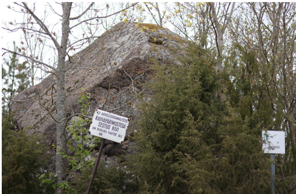
Foto 2. Väkra hiiekivi.

Väkra külas asub ka riikliku kaitse all olev Saaremaa suurim ohvrikivi (foto 2). Viie meetri kõrgust, keset vana hiit asetsevat kivi ümbritsevad kolmest küljest puud, mis kivi juba katavad ja peidavad. 2023. aastal on hiiekivi seisukord hinnatud heaks (Kultuurimälestiste register, 2023).