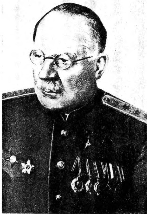
Н. Н. Бурденко