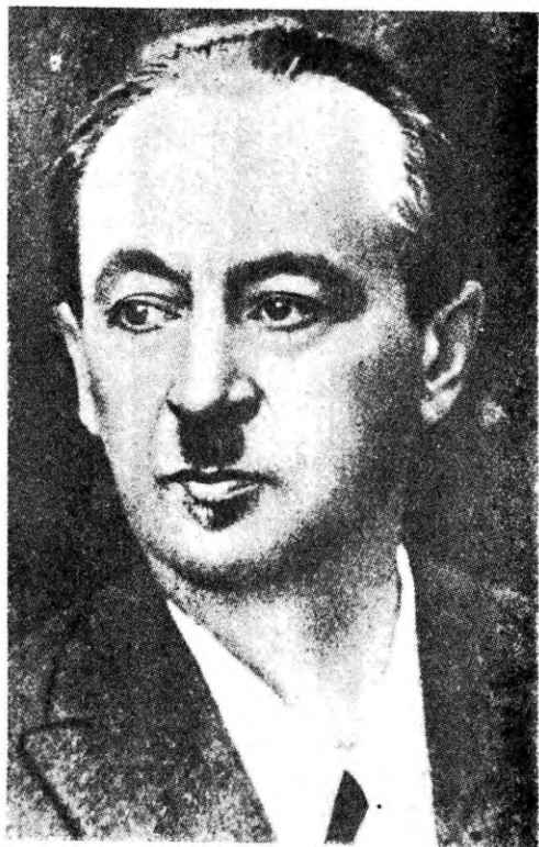
Л. В. Писсаржевский