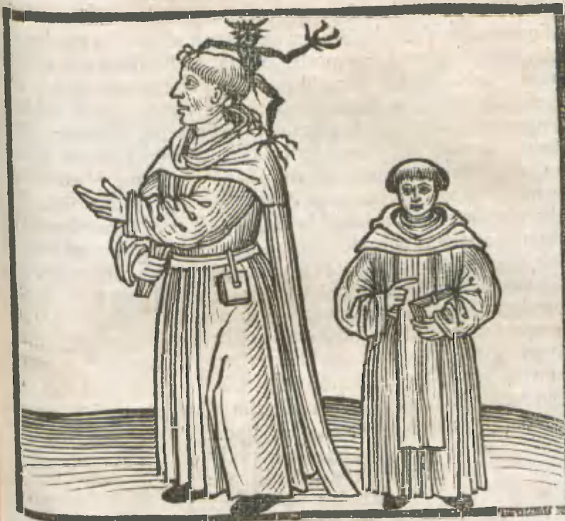
CAPVT TRICESIMVM TERTIVM

MONACHVS IN ALBA CVCVLLA, & diabolus in scapulis eius, retro habens leripipium longū ad terram cum amplis etiam brachijs, habens discipulum secum stantem.