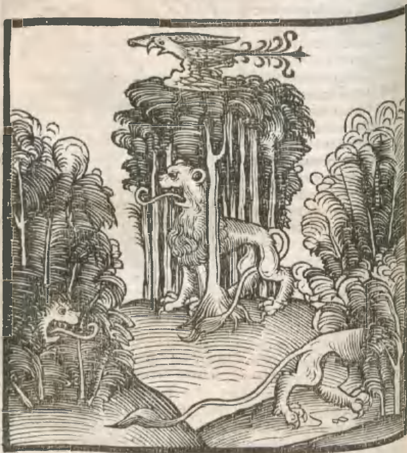
CAPVT VICESIMVM TERTIVM.

AQ VILA SVpra SILVAM VOLANS sub una silua Leo medius uidetur, sub alia silua Leo torus uidetur, sub tertia Leo absconditur.