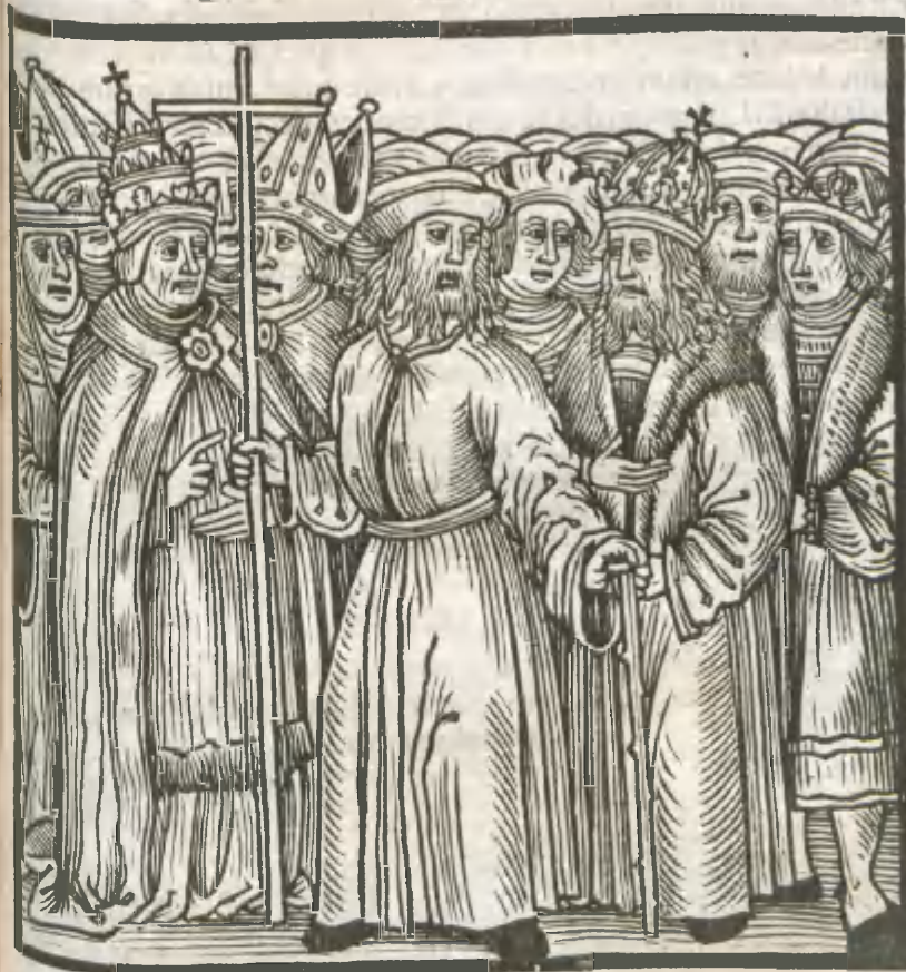
CAPVT TRICESIMVM QVARTVM.