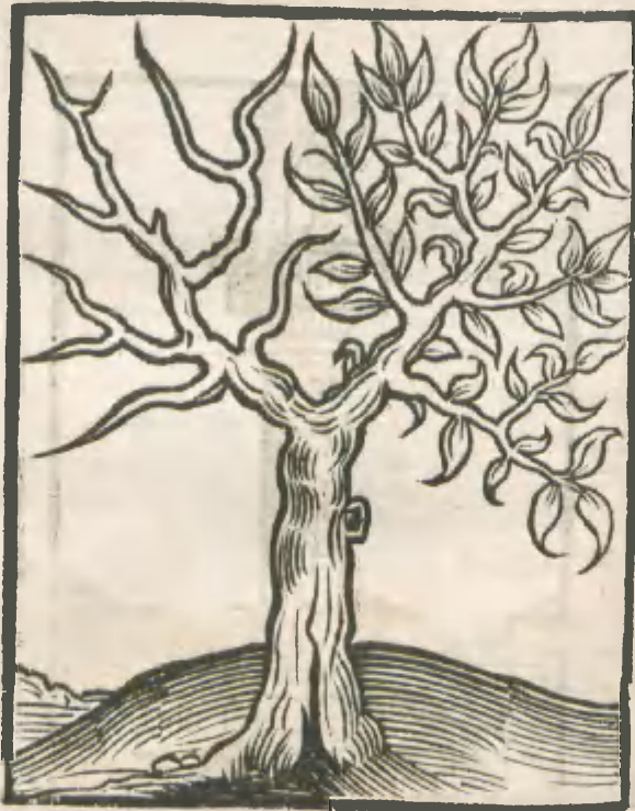
CAPVT VICESIMVM Q VINTVM.

ARBOR TVRCORVM CVM Q VINDECIM ramis, quorum medietas est arida.