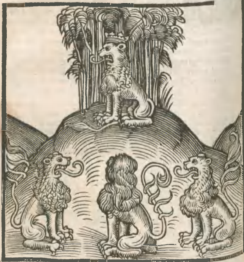
CAPVT VICESIMVMQ VARTVM,

LEO SVpra MONTEM CORONATVS, & tres leones secum sub monte.