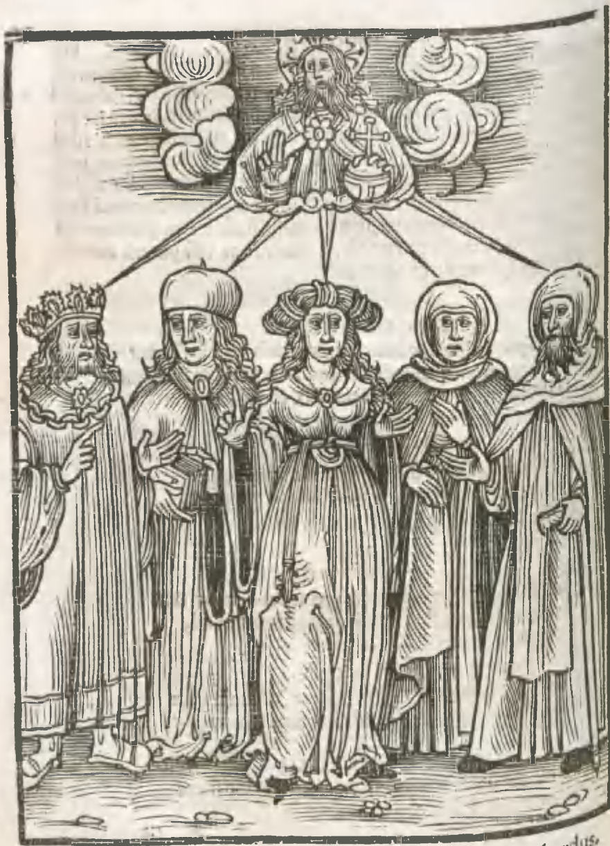
Ptolemaeus. Aristoteles. Sibylla. Brigida. Reynhardus.