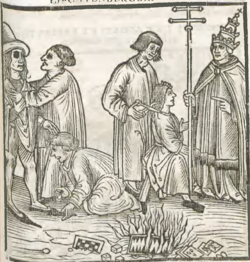
CAPVT TRICESIMVMQ VINTVM.

HIC IUBENTVR COMBURI ALEAE ET uestes seculares difformes, rostra calceorum iuxta Papam abscindi, & pili decurari per hunc prophetam