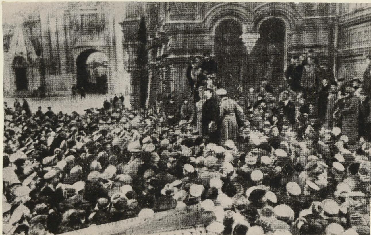
Выступление большевика В.П. Ногина на митинге в Москве у здания Исторического музея.